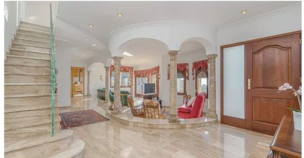
Spanien Costa-Brava Ferienhaus