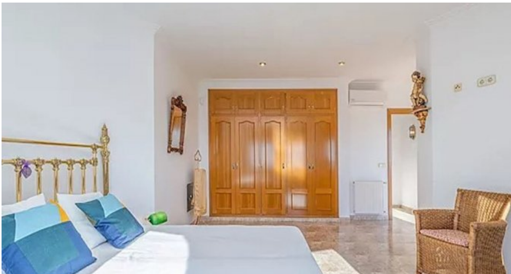
Spanien Costa-Brava Ferienhaus