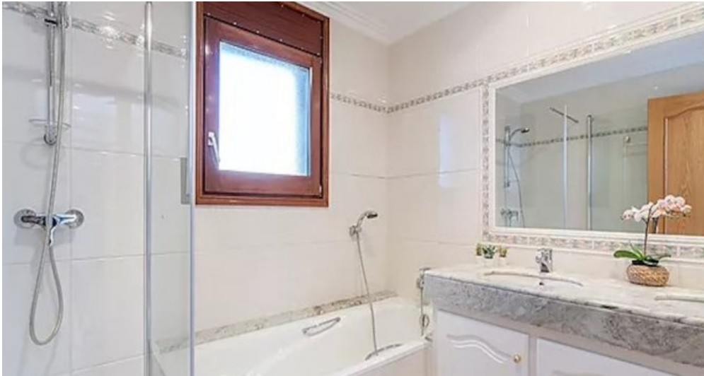
Spanien Costa-Brava Ferienhaus