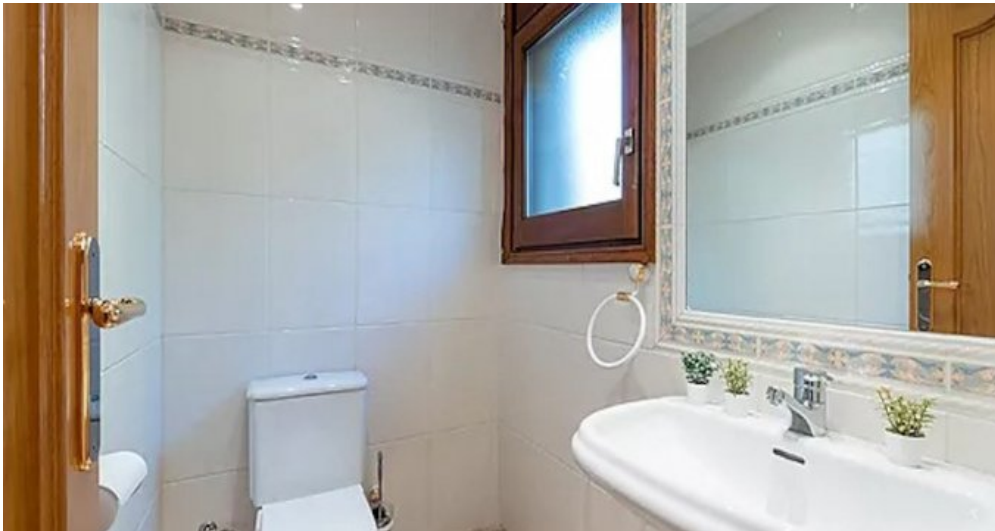
Spanien Costa-Brava Ferienhaus