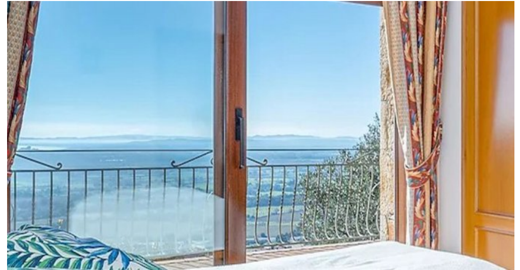
Spanien Costa-Brava Ferienhaus