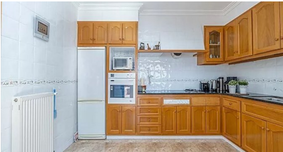
Spanien Costa-Brava Ferienhaus