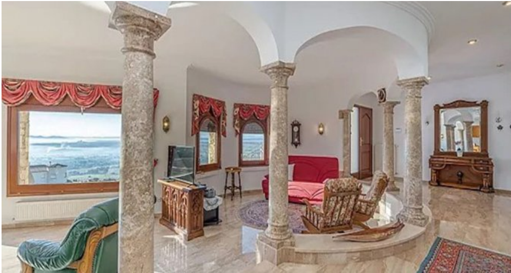
Spanien Costa-Brava Ferienhaus