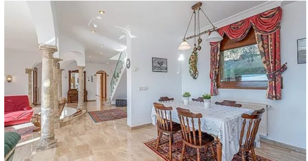
Spanien Costa-Brava Ferienhaus