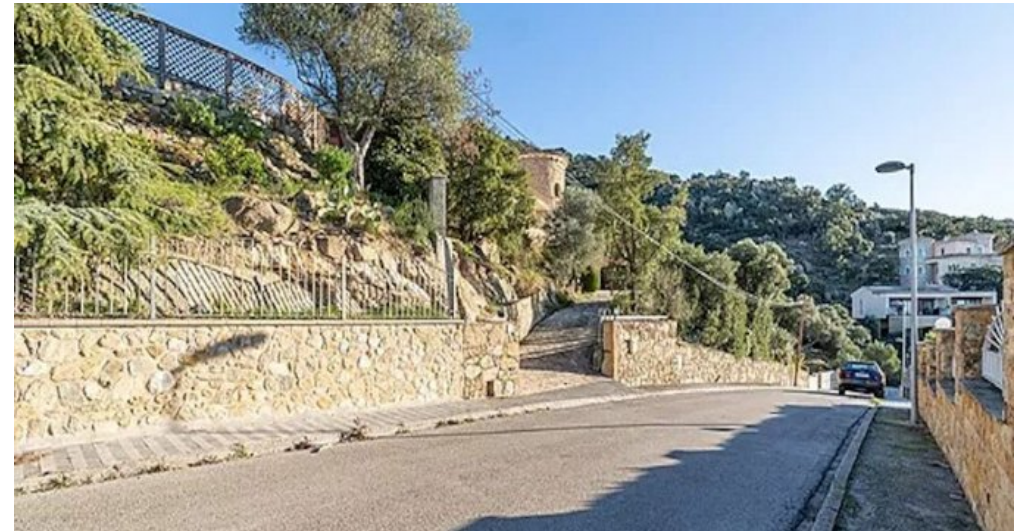
Spanien Costa-Brava Ferienhaus