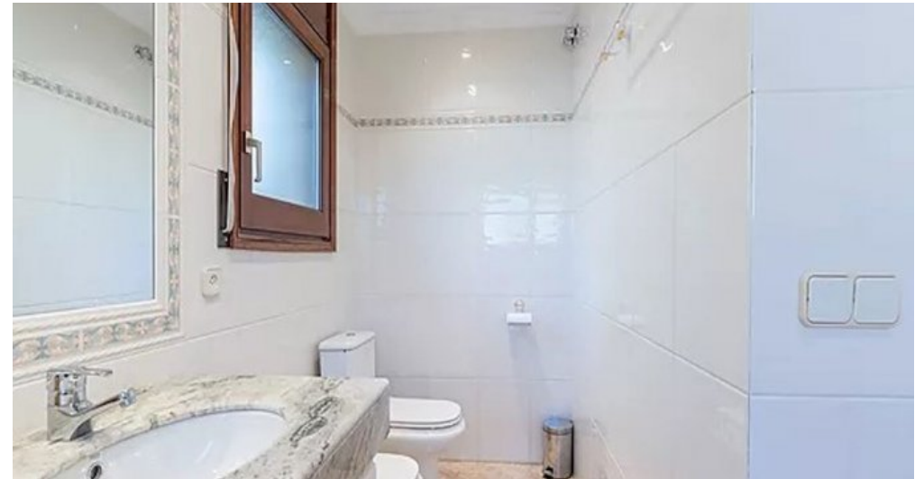
Spanien Costa-Brava Ferienhaus