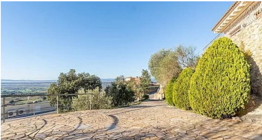
Spanien Costa-Brava Ferienhaus