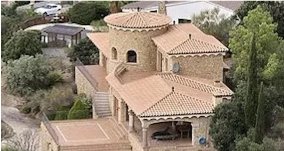
Spanien Costa-Brava Ferienhaus