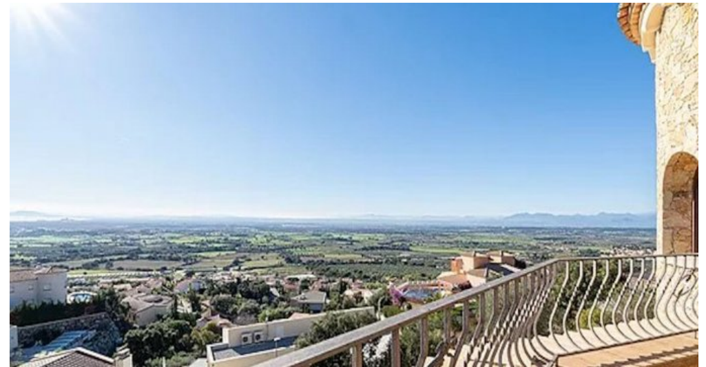
Spanien Costa-Brava Ferienhaus