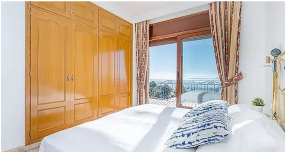
Spanien Costa-Brava Ferienhaus