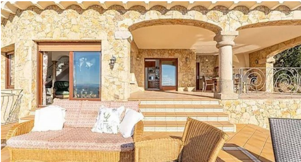
Spanien Costa-Brava Ferienhaus