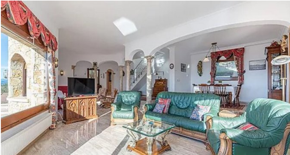
Spanien Costa-Brava Ferienhaus