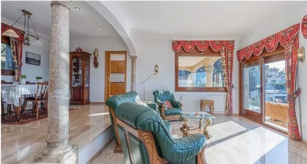
Spanien Costa-Brava Ferienhaus