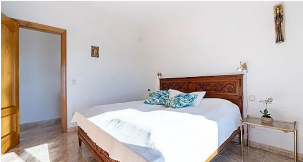
Spanien Costa-Brava Ferienhaus