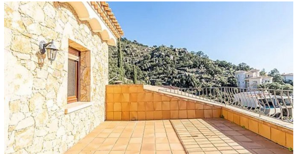
Spanien Costa-Brava Ferienhaus