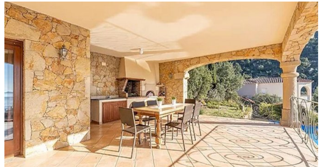
Spanien Costa-Brava Ferienhaus