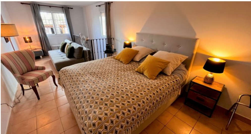
Room Torremolinos 22