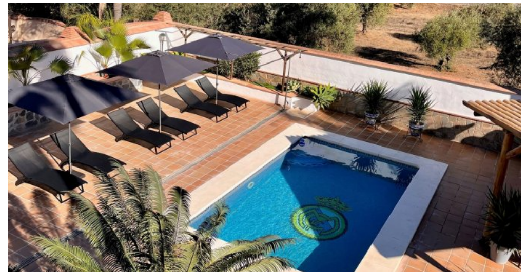
IMG_5219 - kopie