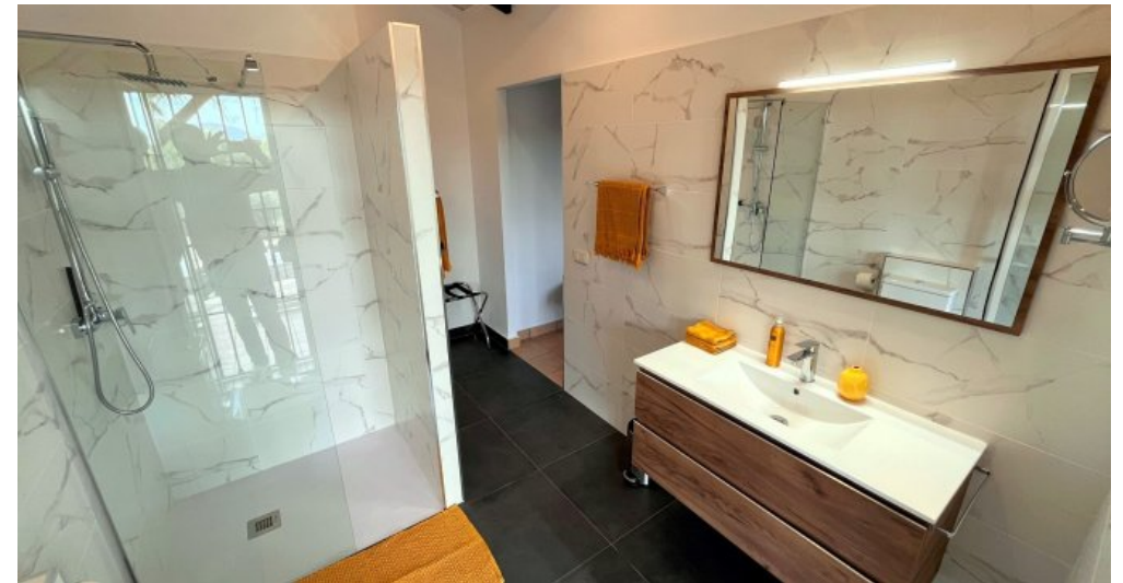
Room Marbella 22