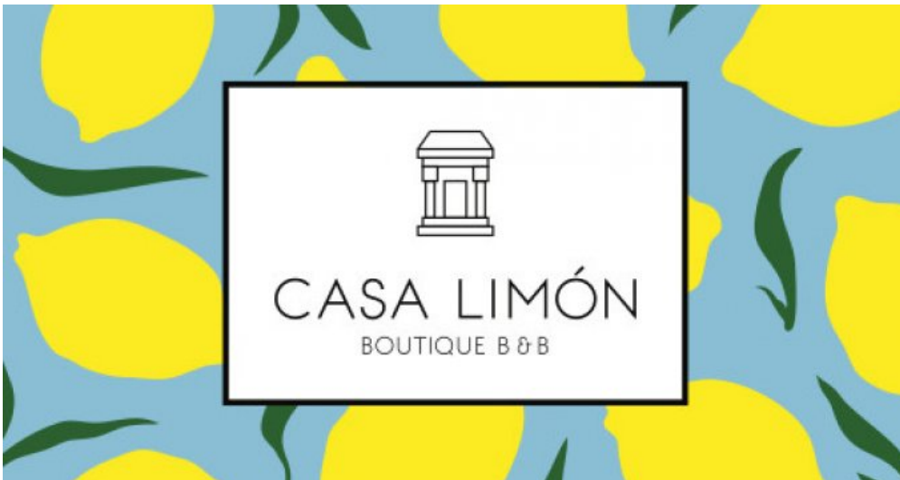
Logo .gif-14 kopie