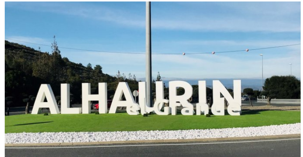
Alhaurin el Grande 15.46.15