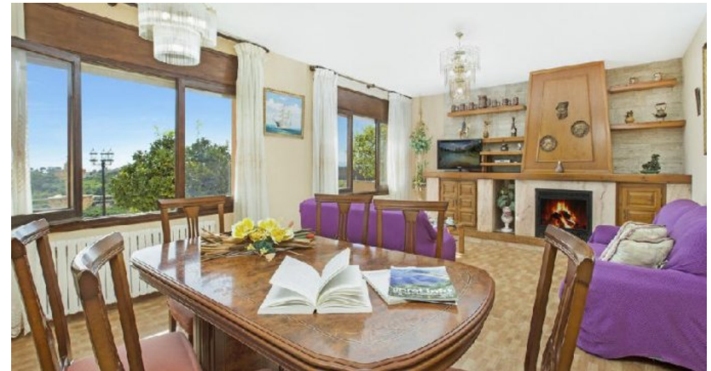
Großes Ferienhaus in Blanes zu verkaufen