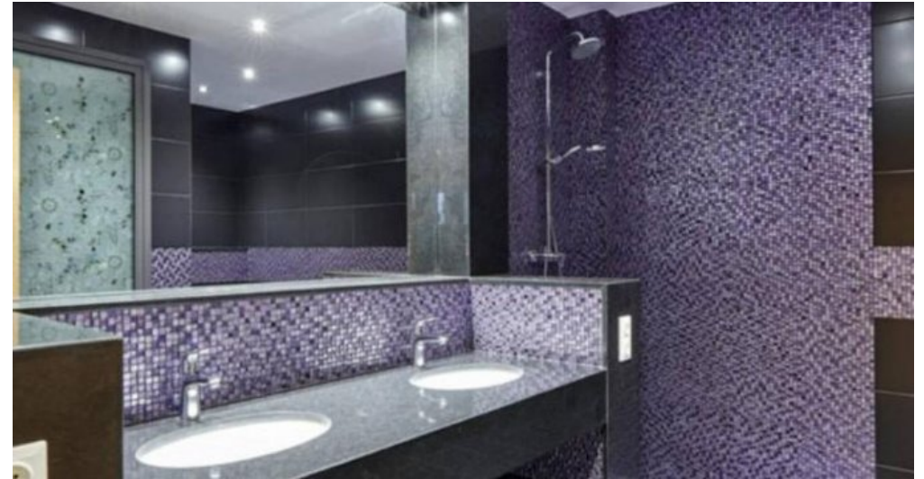
Neubau Feienhaus Lloret de Mar - Spanien kaufen