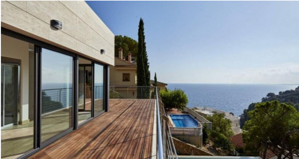
Neubau Feienhaus Lloret de Mar - Spanien kaufen