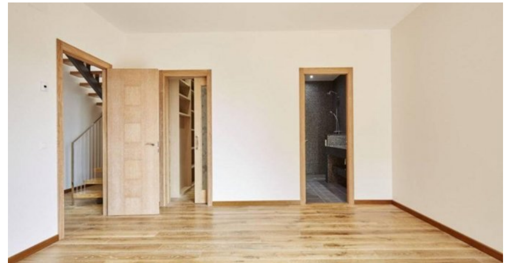
Neubau Feienhaus Lloret de Mar - Spanien kaufen