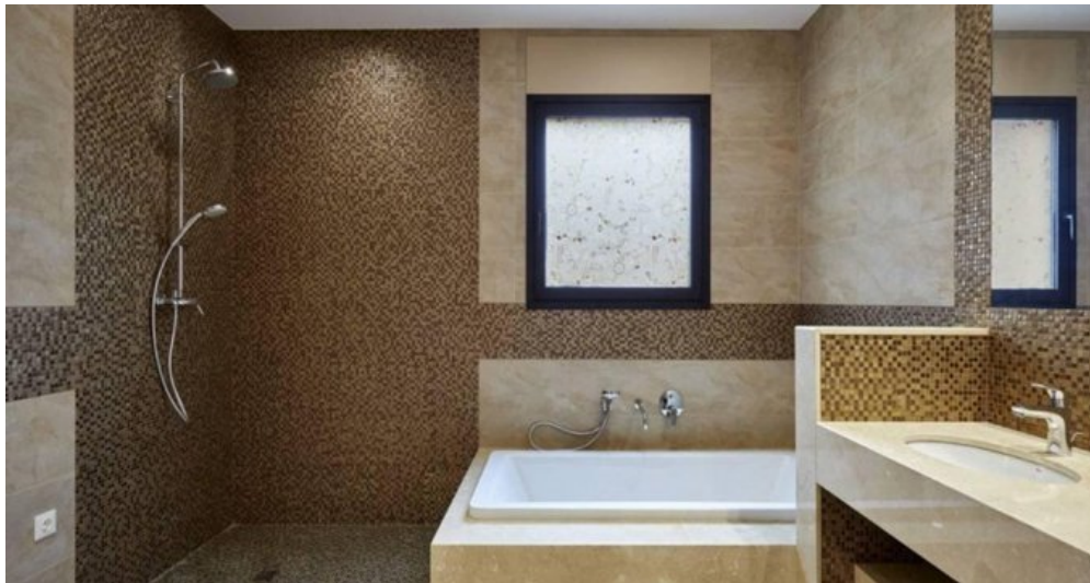
Neubau Feienhaus Lloret de Mar - Spanien kaufen