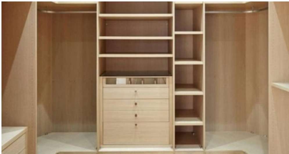
Neubau Feienhaus Lloret de Mar - Spanien kaufen