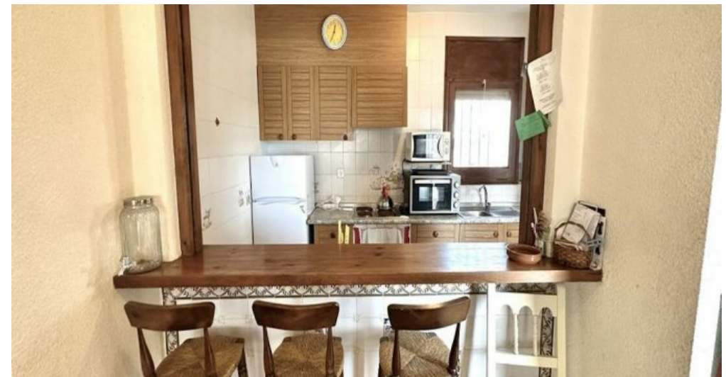
Empuriabrava ebenerdiges Ferienhaus kaufen