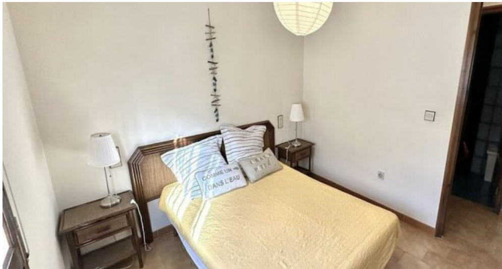
Empuriabrava ebenerdiges Ferienhaus kaufen