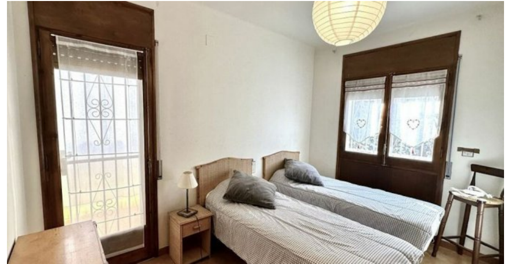
Empuriabrava ebenerdiges Ferienhaus kaufen