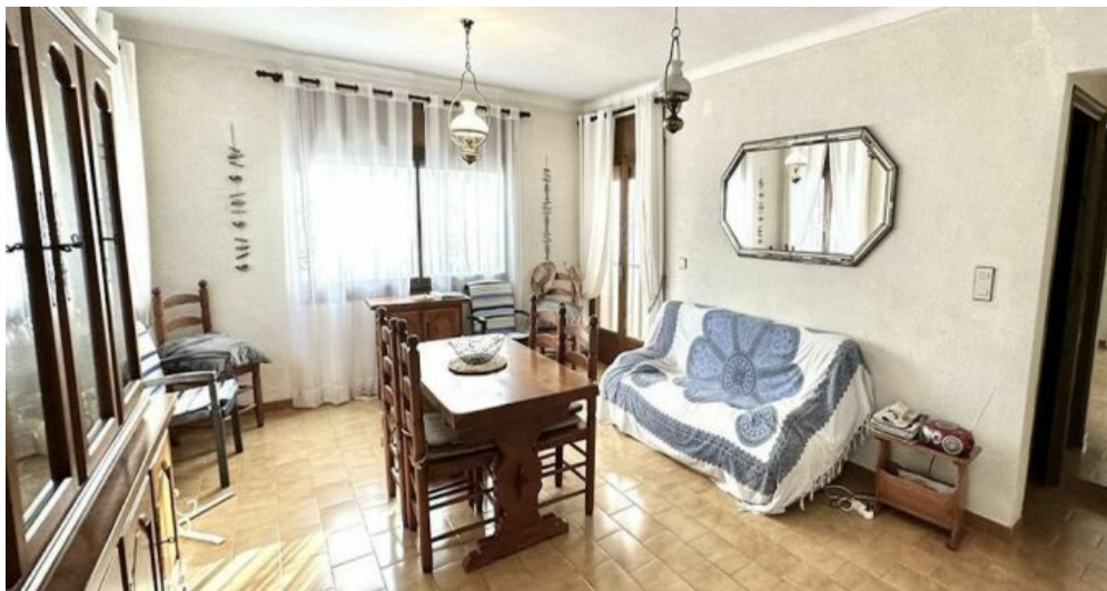
Empuriabrava ebenerdiges Ferienhaus kaufen