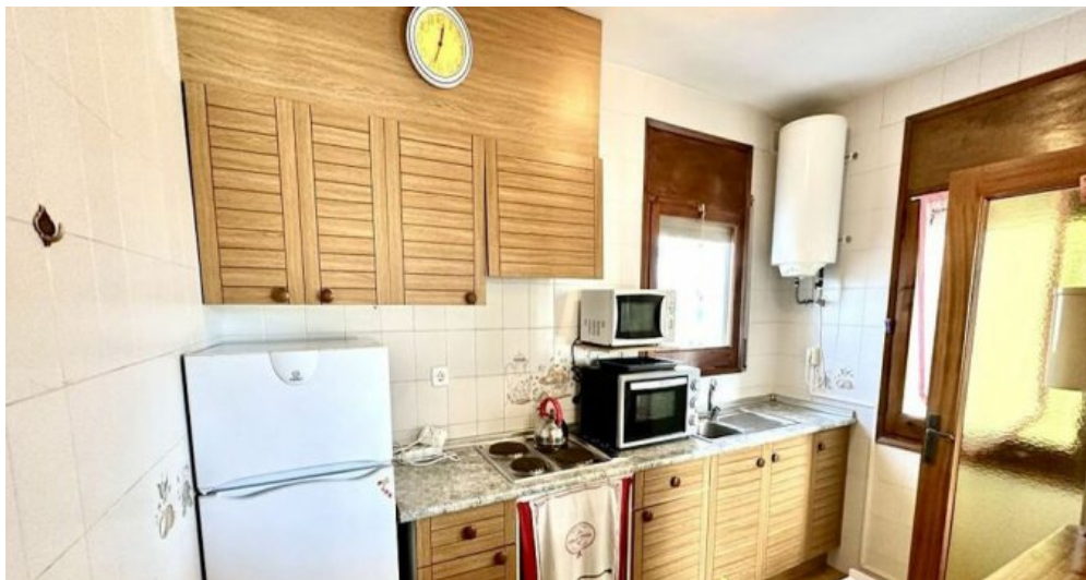
Empuriabrava ebenerdiges Ferienhaus kaufen