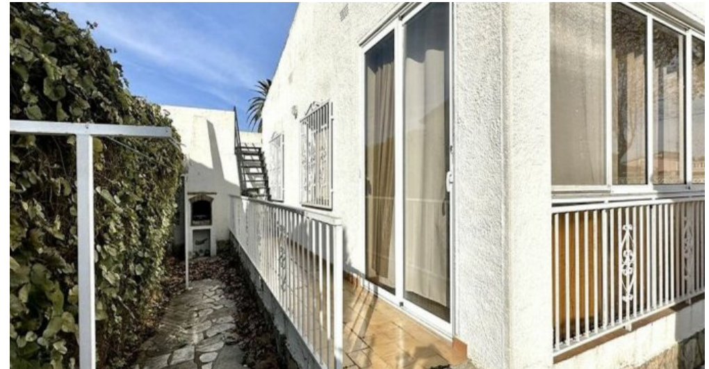
Empuriabrava ebenerdiges Ferienhaus kaufen