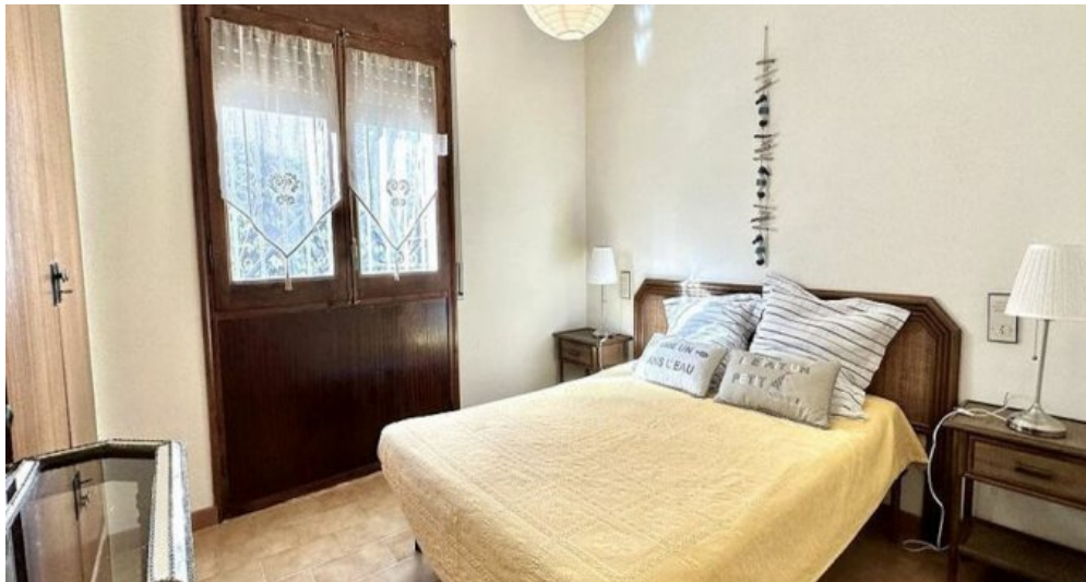
Empuriabrava ebenerdiges Ferienhaus kaufen