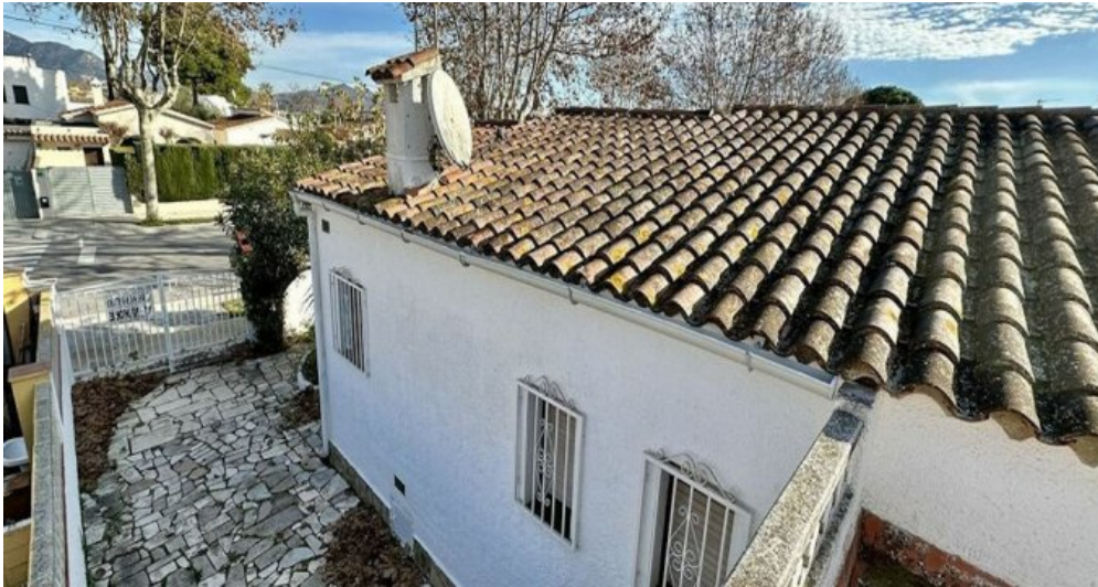
Empuriabrava ebenerdiges Ferienhaus kaufen