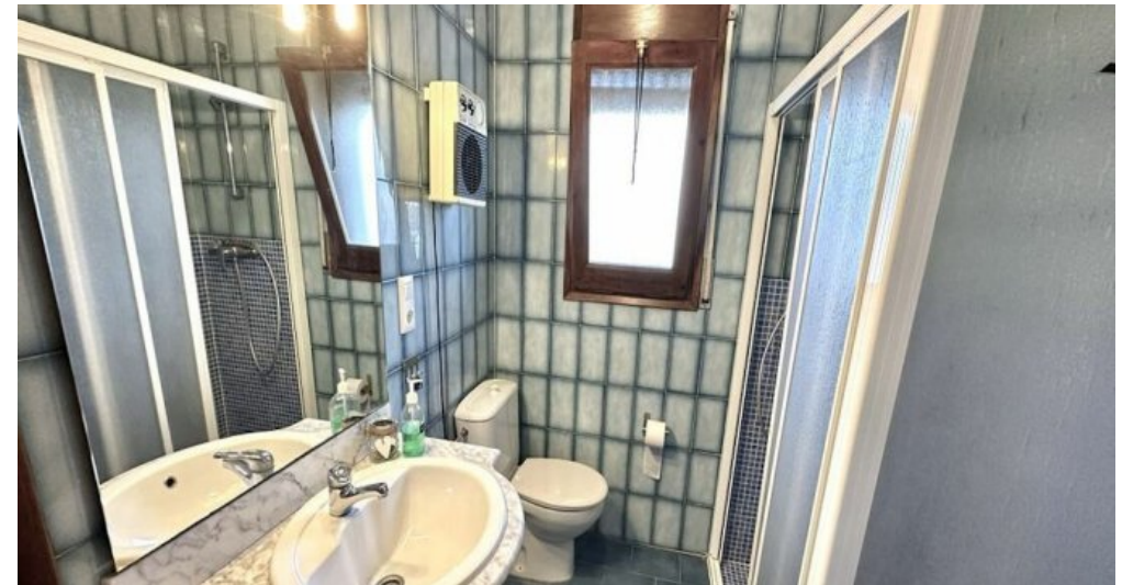
Empuriabrava ebenerdiges Ferienhaus kaufen