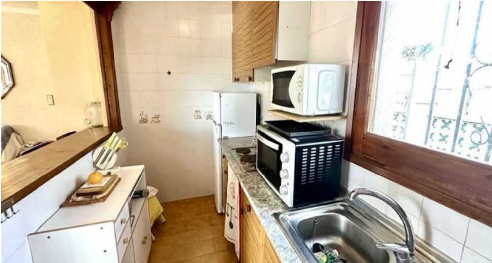
Empuriabrava ebenerdiges Ferienhaus kaufen