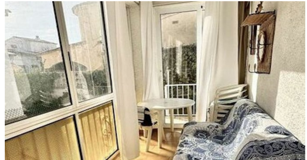
Empuriabrava ebenerdiges Ferienhaus kaufen