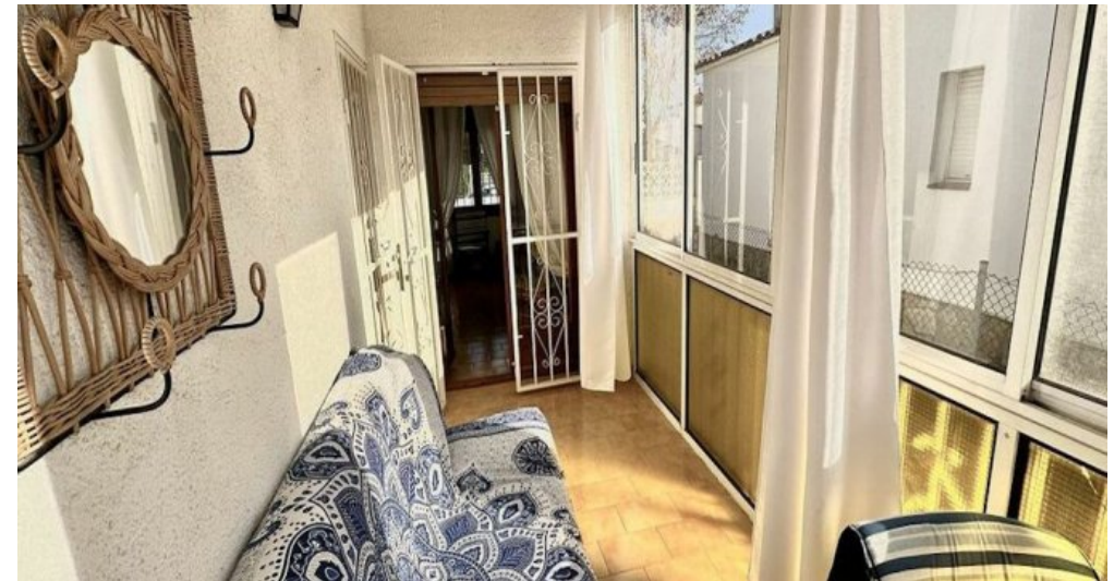
Empuriabrava ebenerdiges Ferienhaus kaufen