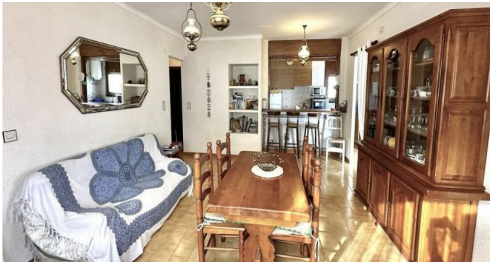
Empuriabrava ebenerdiges Ferienhaus kaufen