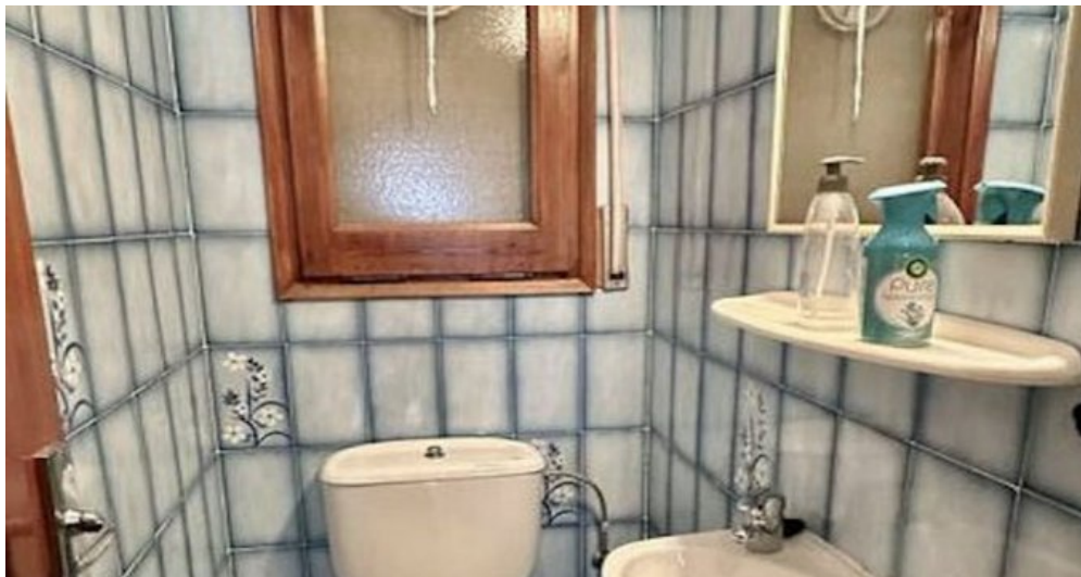
Empuriabrava ebenerdiges Ferienhaus kaufen