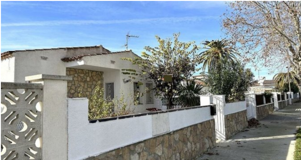
Empuriabrava ebenerdiges Ferienhaus kaufen