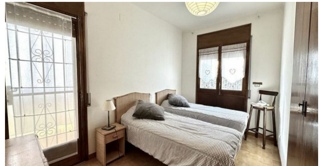
Empuriabrava ebenerdiges Ferienhaus kaufen