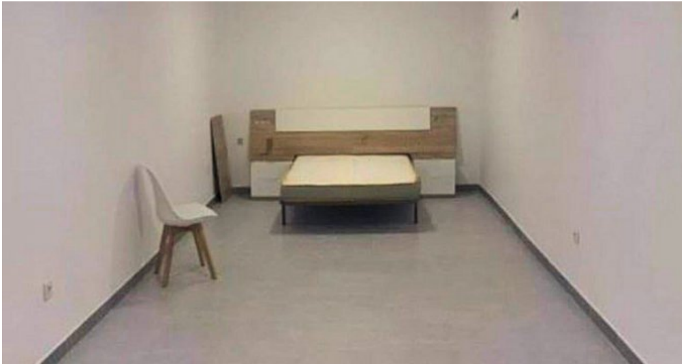
Appartements Torremolinos Costa del Sol kaufen