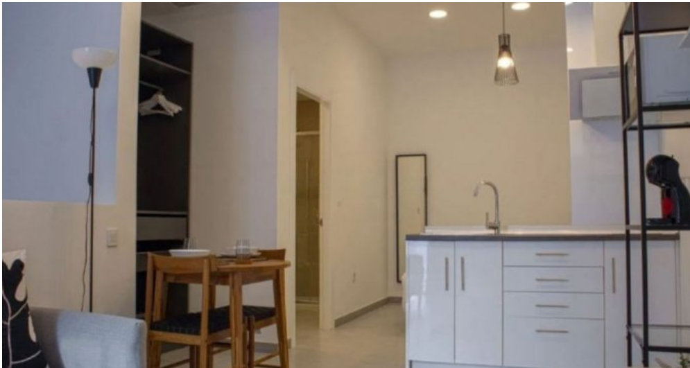
Appartements Torremolinos Costa del Sol kaufen