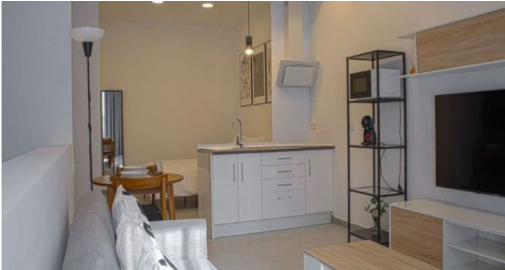
Appartements Torremolinos Costa del Sol kaufen