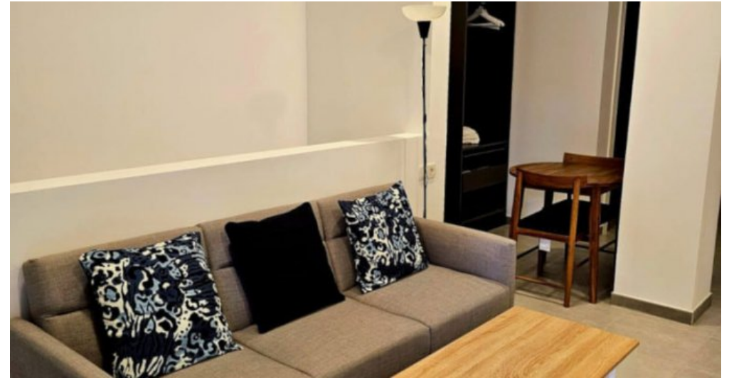
Appartements Torremolinos Costa del Sol kaufen