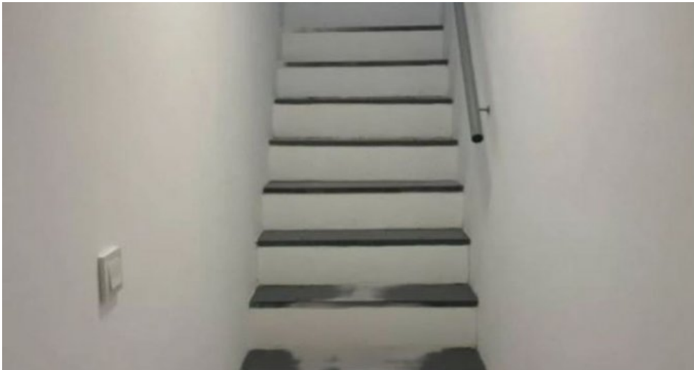
Appartements Torremolinos Costa del Sol kaufen