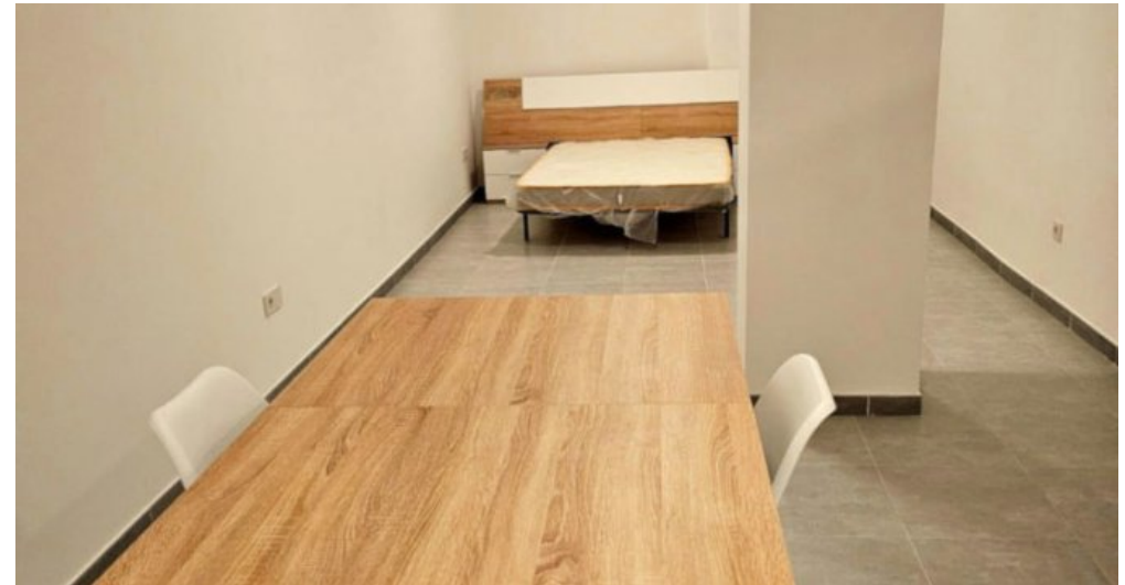
Appartements Torremolinos Costa del Sol kaufen