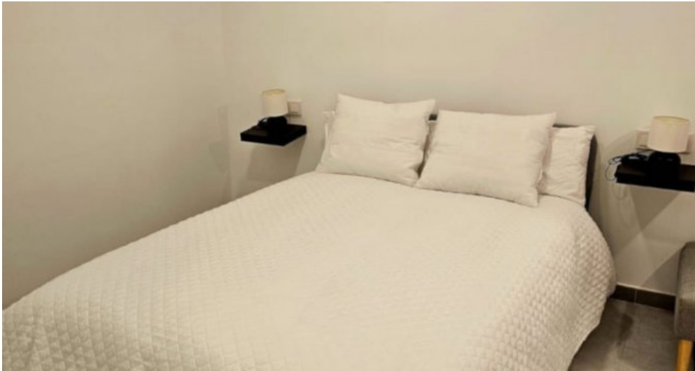
Appartements Torremolinos Costa del Sol kaufen