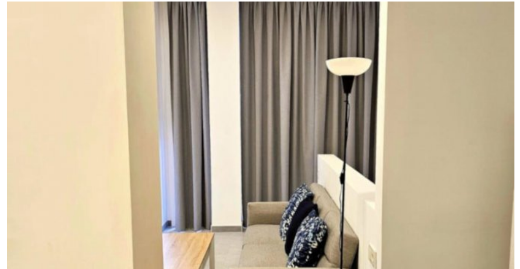
Appartements Torremolinos Costa del Sol kaufen