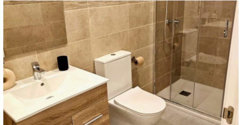
Appartements Torremolinos Costa del Sol kaufen