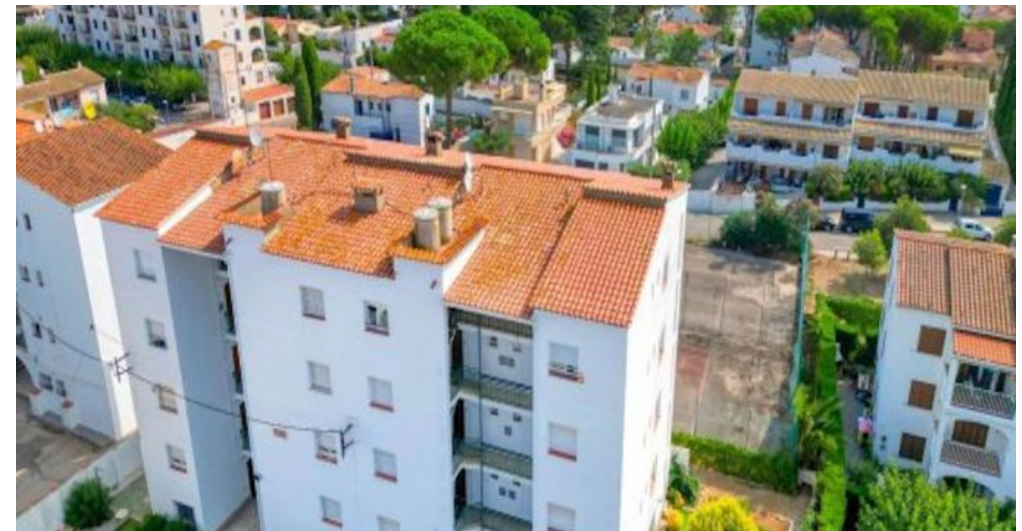
Ferienwohnung in L'Escala - Costa Brava - Spanien