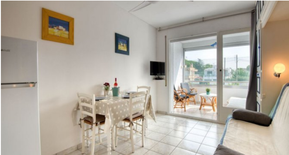
Ferienwohnung in L'Escala - Costa Brava - Spanien