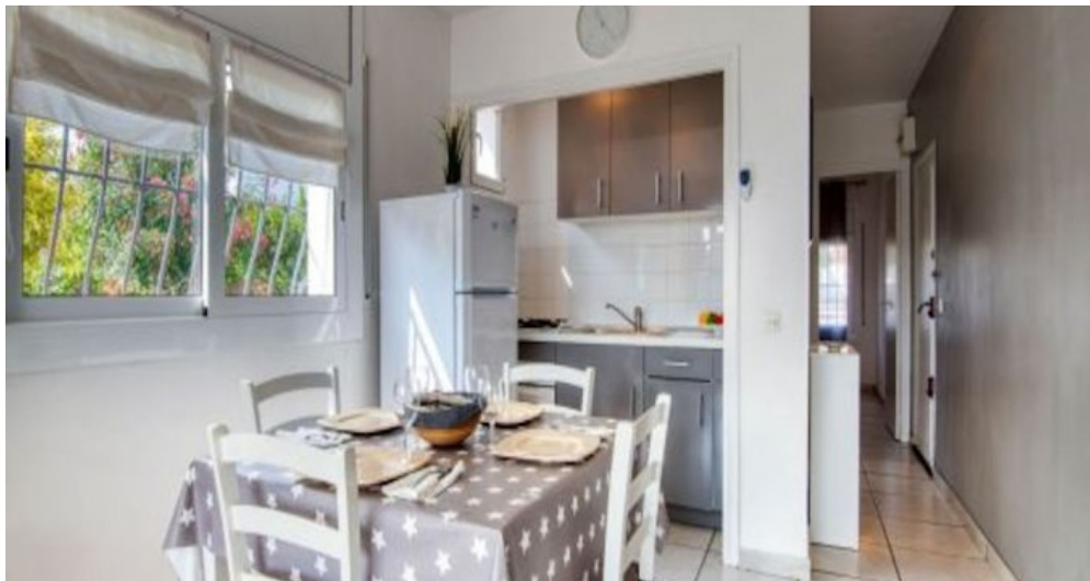
Ferienwohnung in L'Escalade - Costa Brava - Spanien