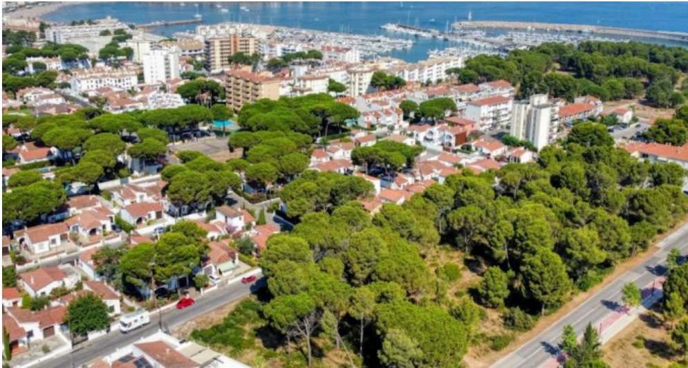
Ferienwohnung in L'Escala - Costa Brava - Spanien