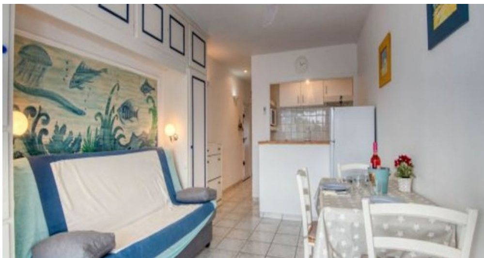
Ferienwohnung in L'Escala - Costa Brava - Spanien