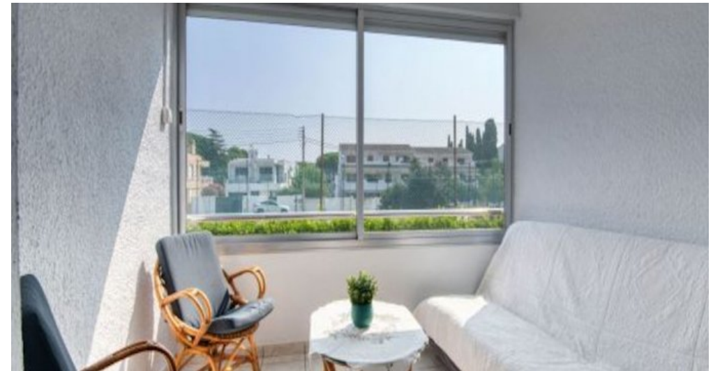
Ferienwohnung in L'Escalade - Costa Brava - Spanien