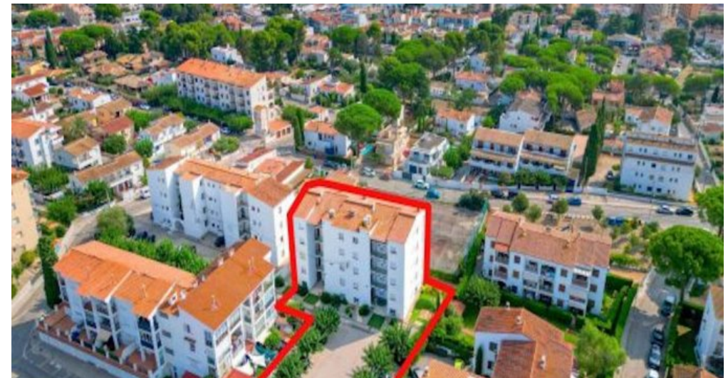
Ferienwohnung in L'Escalade - Costa Brava - Spanien