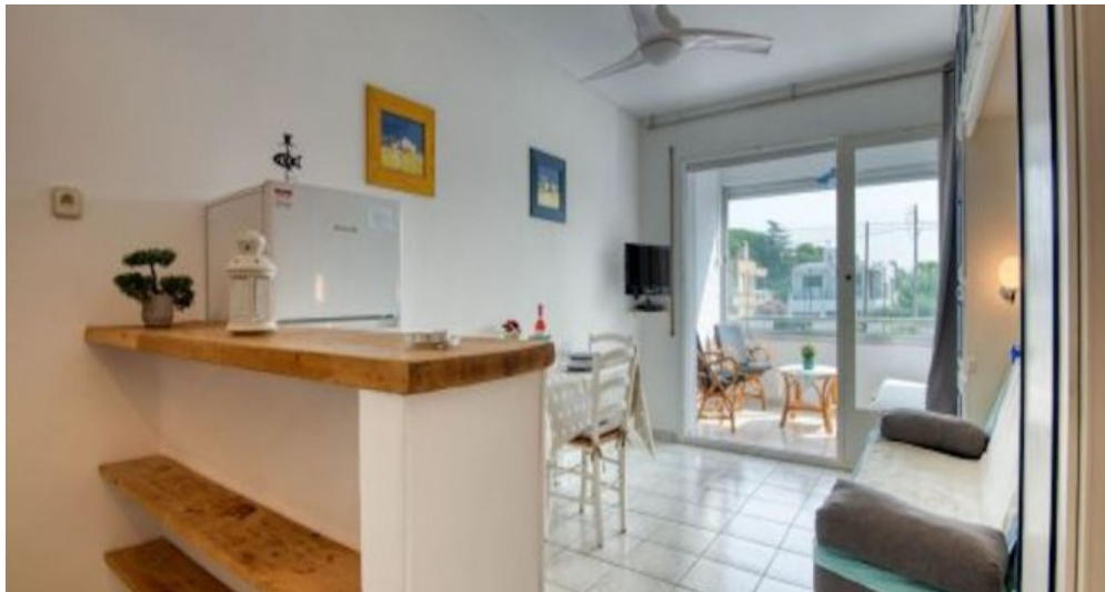
Ferienwohnung in L'Escalade - Costa Brava - Spanien