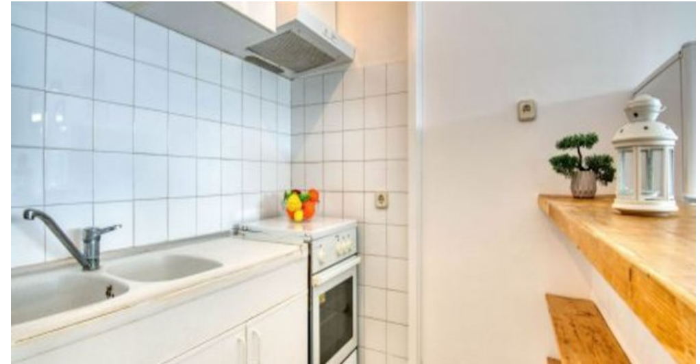
Ferienwohnung in L'Escala - Costa Brava - Spanien