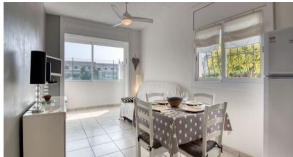
Ferienwohnung in L'Escala - Costa Brava - Spanien