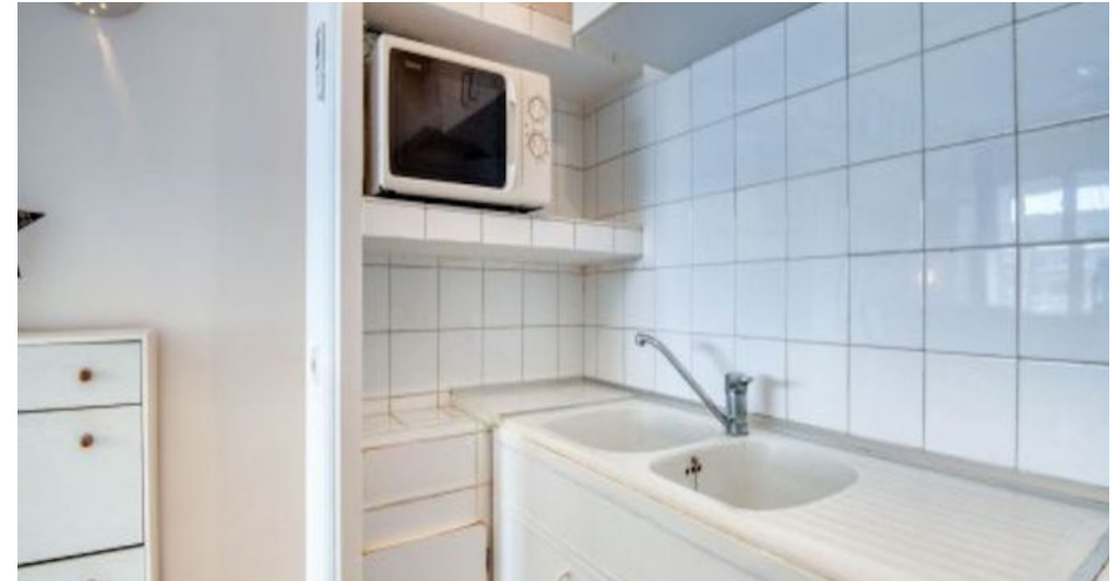
Ferienwohnung in L'Escala - Costa Brava - Spanien