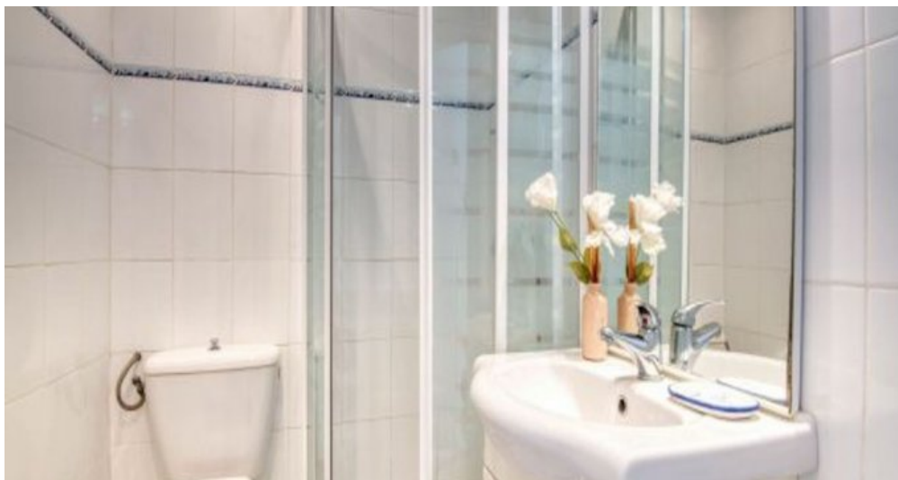
Ferienwohnung in L'Escala - Costa Brava - Spanien