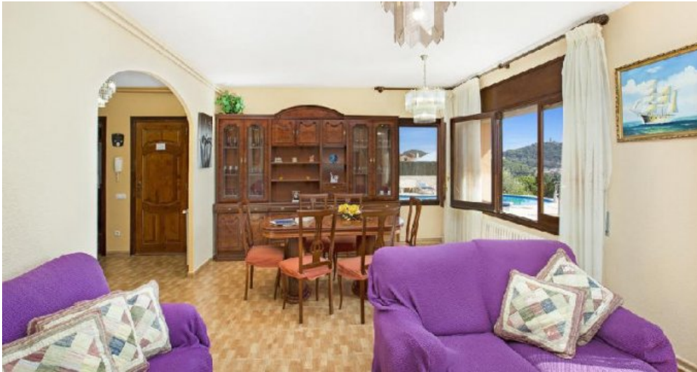
Großes Ferienhaus in Blanes zu verkaufen