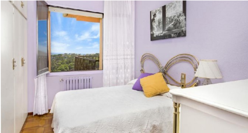
Großes Ferienhaus in Blanes zu verkaufen