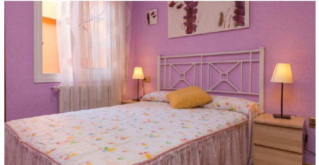
Großes Ferienhaus in Blanes zu verkaufen