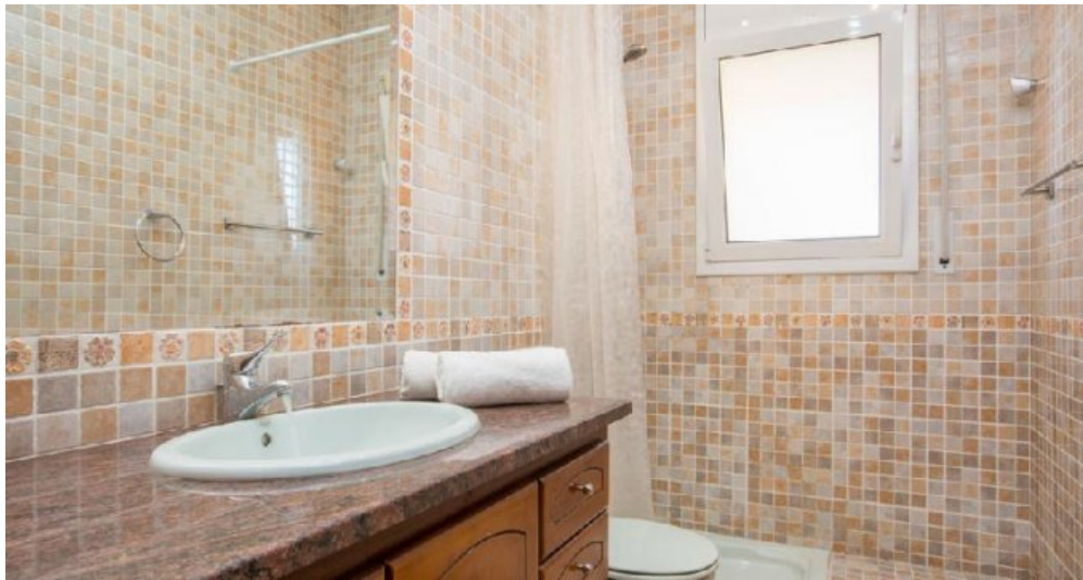
Großes Ferienhaus in Blanes zu verkaufen