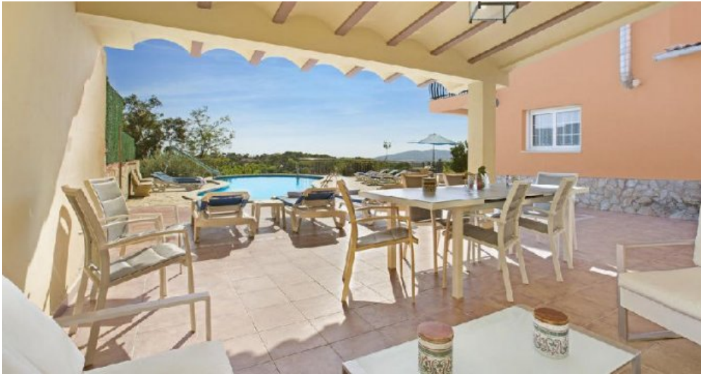
Großes Ferienhaus in Blanes zu verkaufen