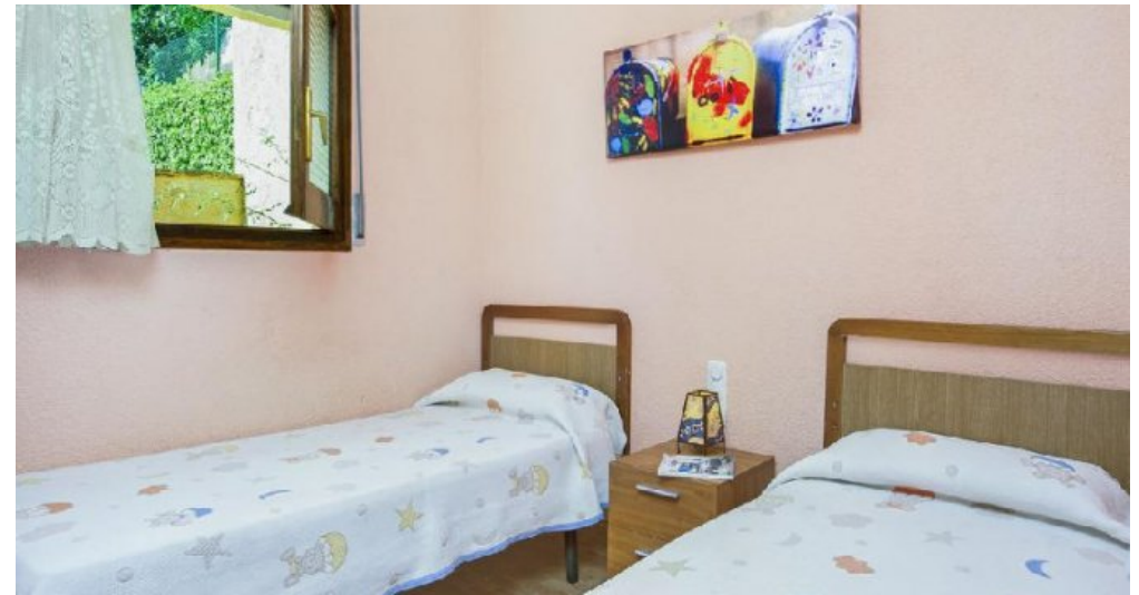
Großes Ferienhaus in Blanes zu verkaufen