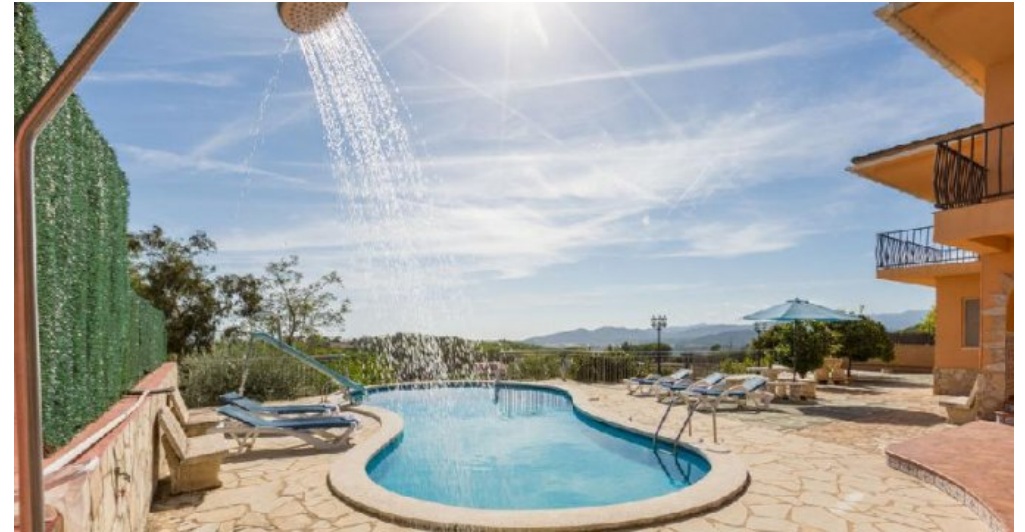
Großes Ferienhaus in Blanes zu verkaufen