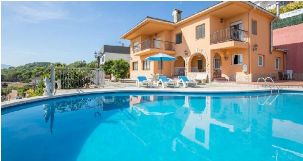
Großes Ferienhaus in Blanes zu verkaufen