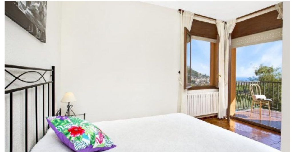
Großes Ferienhaus in Blanes zu verkaufen