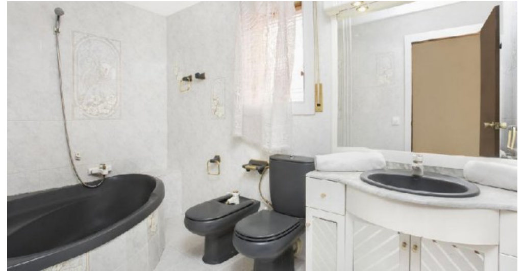
Großes Ferienhaus in Blanes zu verkaufen