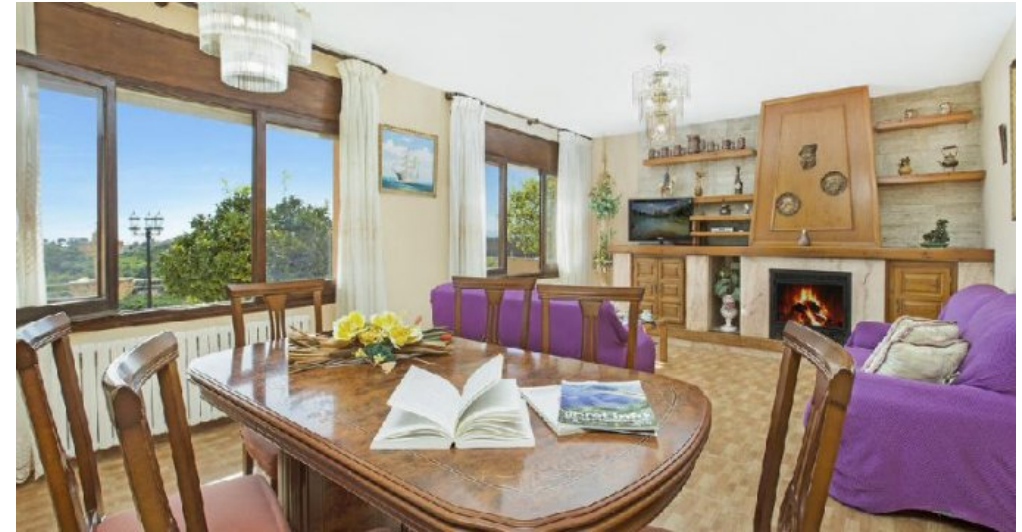
Großes Ferienhaus in Blanes zu verkaufen