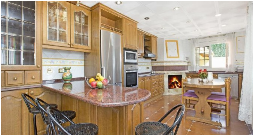
Großes Ferienhaus in Blanes zu verkaufen