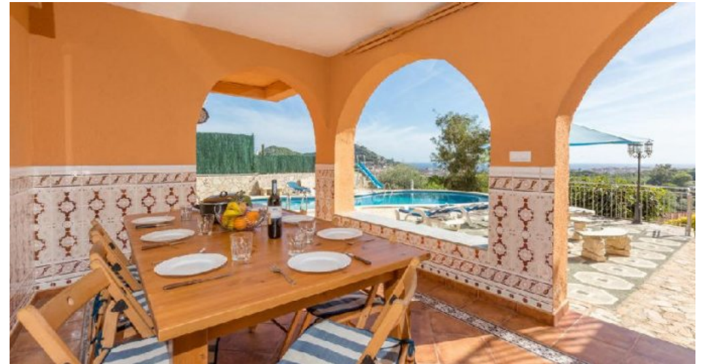
Großes Ferienhaus in Blanes zu verkaufen