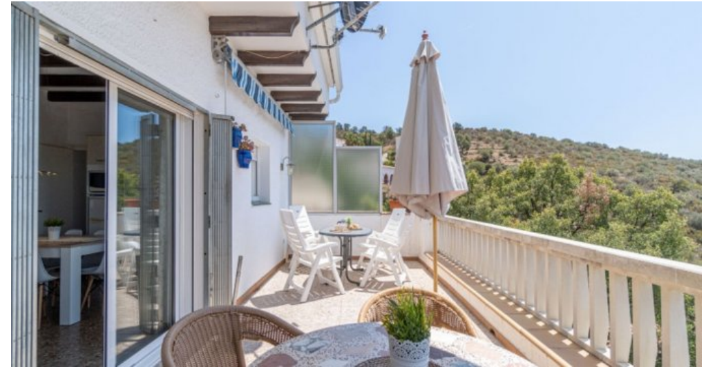
Ferienvilla privater Pool und Blick auf die Bucht von Rosas