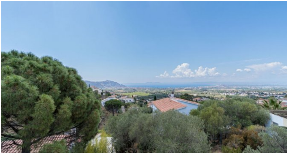
Ferienvilla privater Pool und Blick auf die Bucht von Rosas