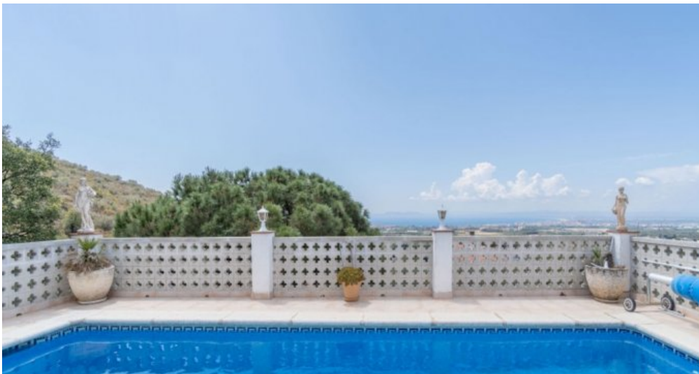
Ferienvilla privater Pool und Blick auf die Bucht von Rosas