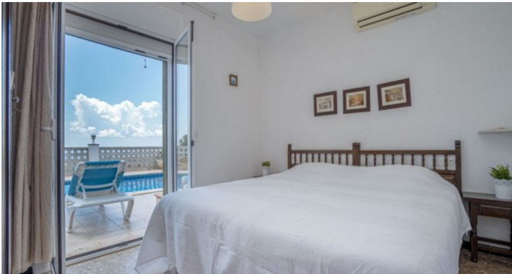
Ferienvilla privater Pool und Blick auf die Bucht von Rosas