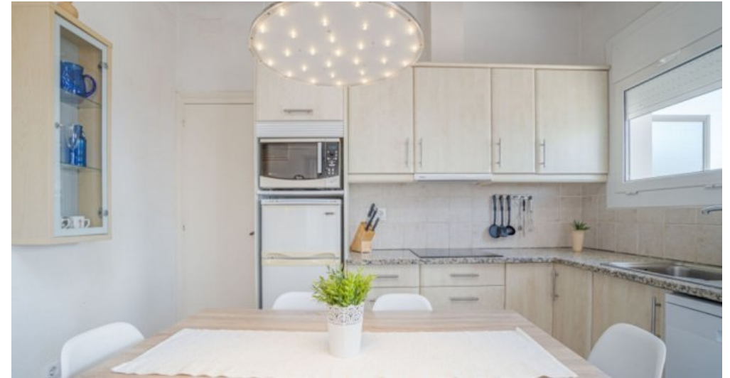
Ferienvilla privater Pool und Blick auf die Bucht von Rosas