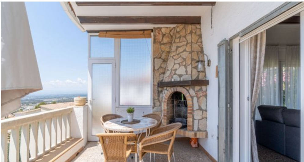
Ferienvilla privater Pool und Blick auf die Bucht von Rosas