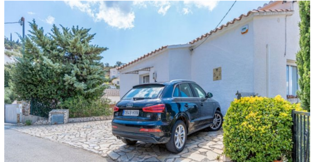
Ferienvilla privater Pool und Blick auf die Bucht von Rosas