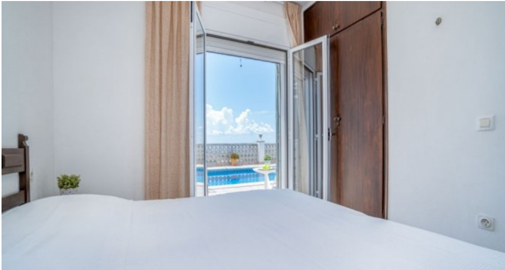
Ferienvilla privater Pool und Blick auf die Bucht von Rosas