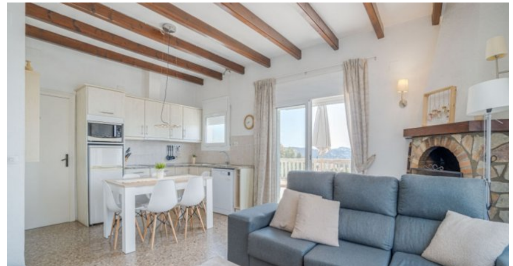
Ferienvilla privater Pool und Blick auf die Bucht von Rosas