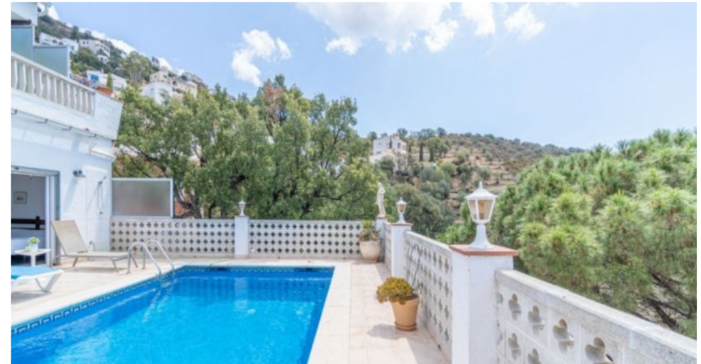
Ferienvilla privater Pool und Blick auf die Bucht von Rosas