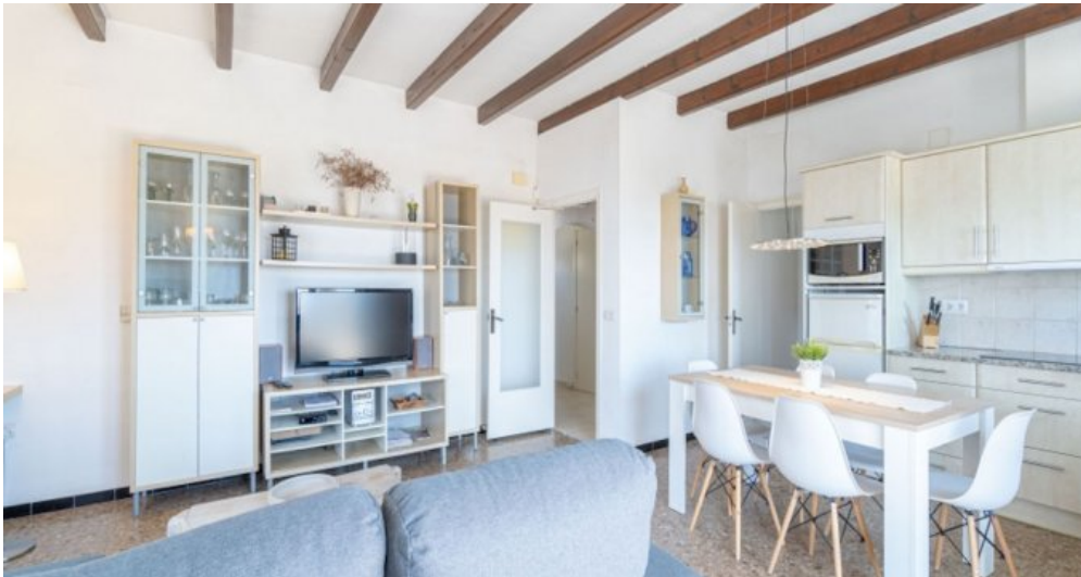
Ferienvilla privater Pool und Blick auf die Bucht von Rosas