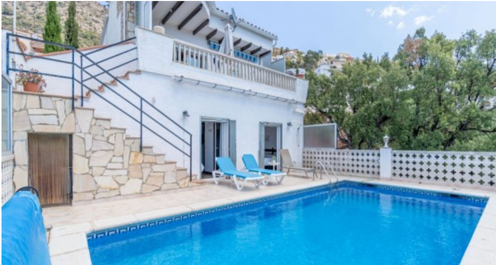
Ferienvilla privater Pool und Blick auf die Bucht von Rosas