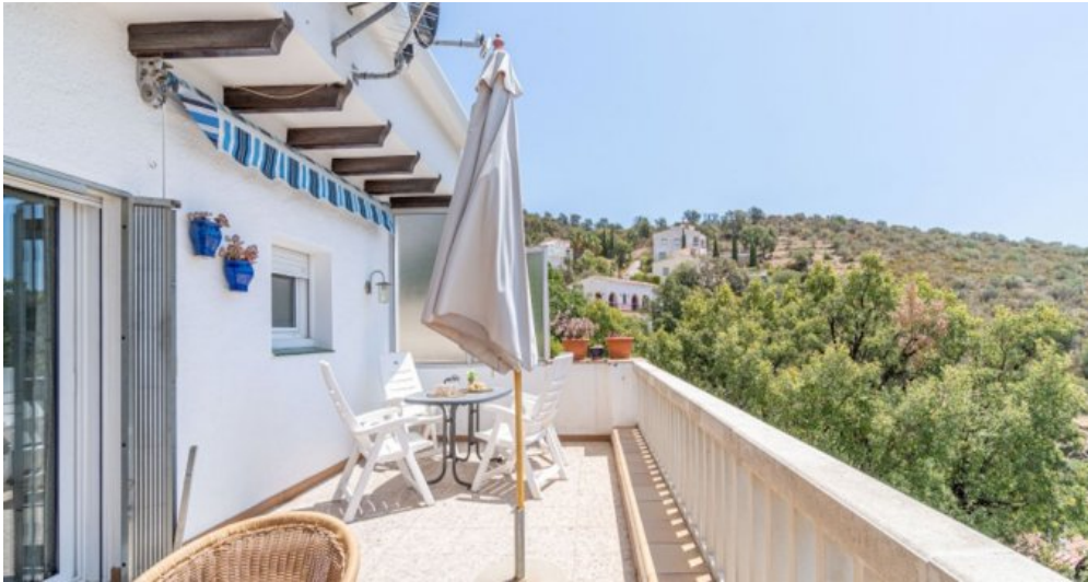
Ferienvilla privater Pool und Blick auf die Bucht von Rosas