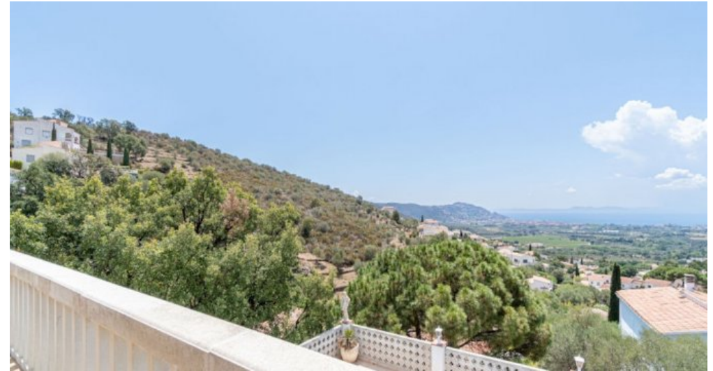
Ferienvilla privater Pool und Blick auf die Bucht von Rosas