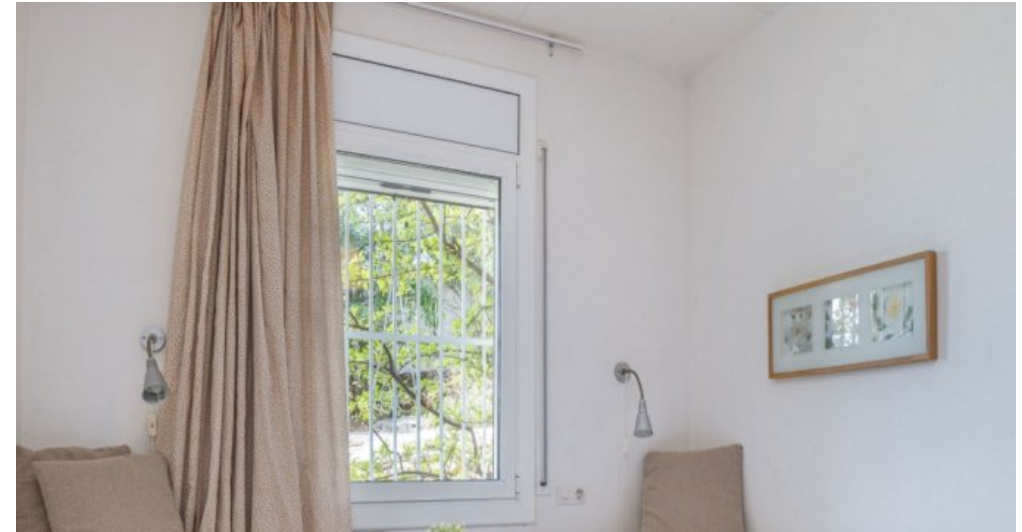
Ferienvilla privater Pool und Blick auf die Bucht von Rosas