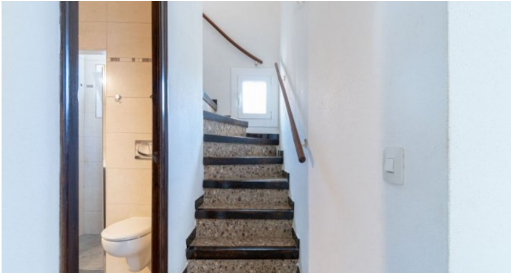
Ferienvilla privater Pool und Blick auf die Bucht von Rosas