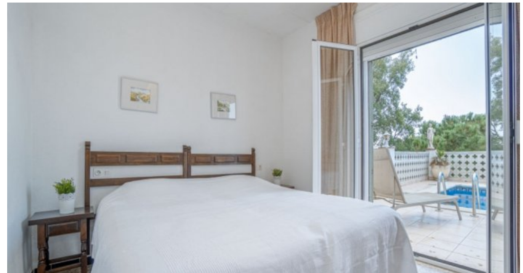
Ferienvilla privater Pool und Blick auf die Bucht von Rosas