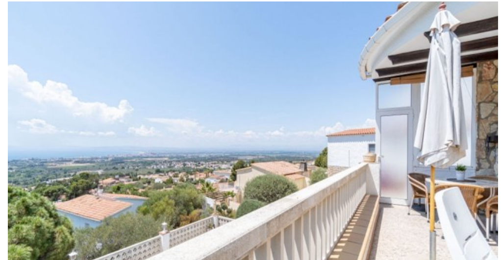
Ferienvilla privater Pool und Blick auf die Bucht von Rosas