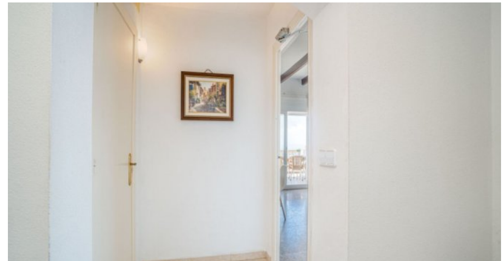
Ferienvilla privater Pool und Blick auf die Bucht von Rosas