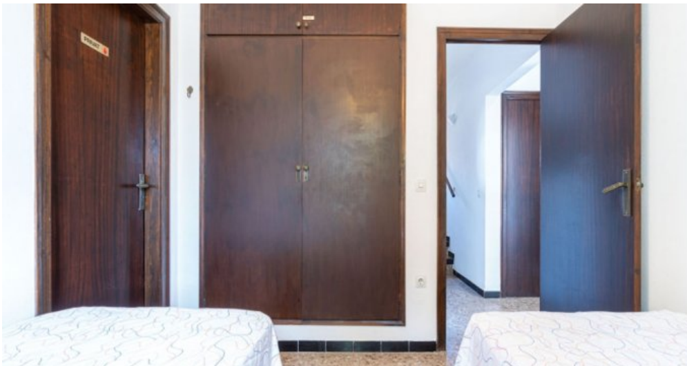
Ferienvilla privater Pool und Blick auf die Bucht von Rosas