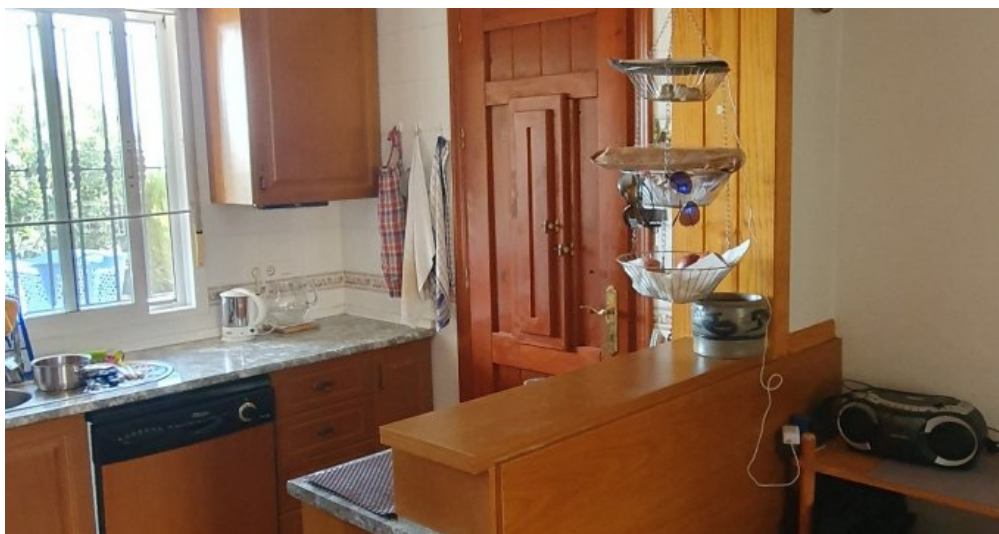
Ferienhaus Spanien Region Murcia Costa Calida