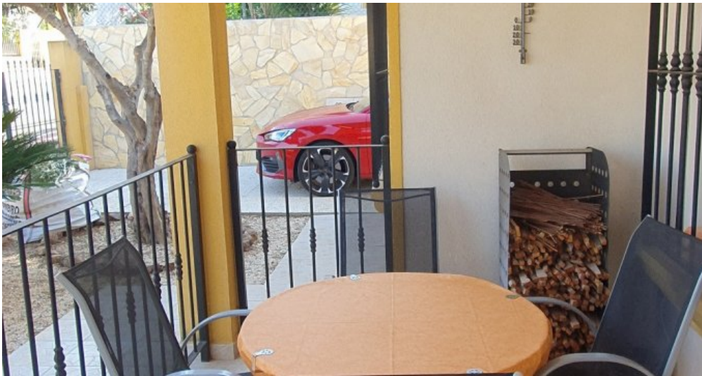
Ferienhaus Spanien Region Murcia Costa Calida