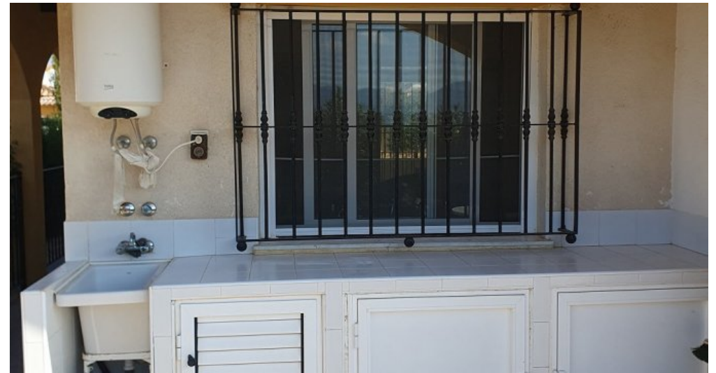
Ferienhaus Spanien Region Murcia Costa Calida