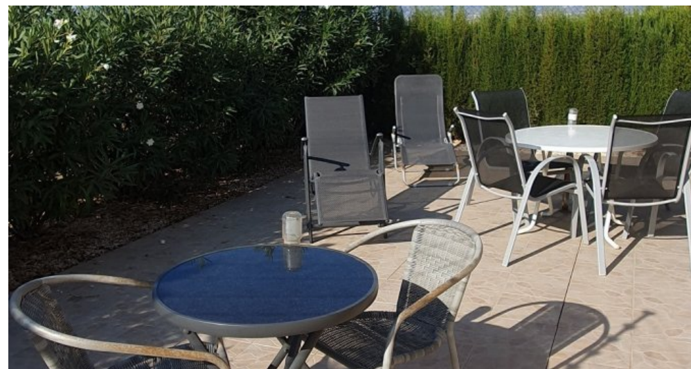
Ferienhaus Spanien Region Murcia Costa Calida