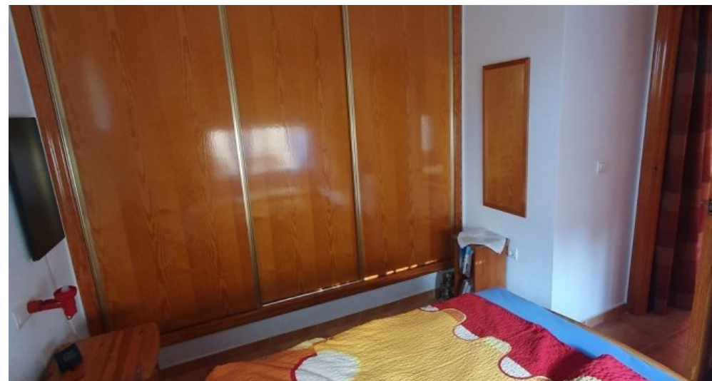
Ferienhaus Spanien Region Murcia Costa Calida