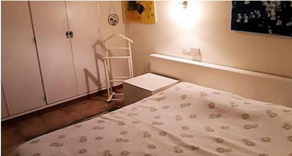
Empuriabrava Ferienhaus mit privatem Pool und Bootsanleger von 15m