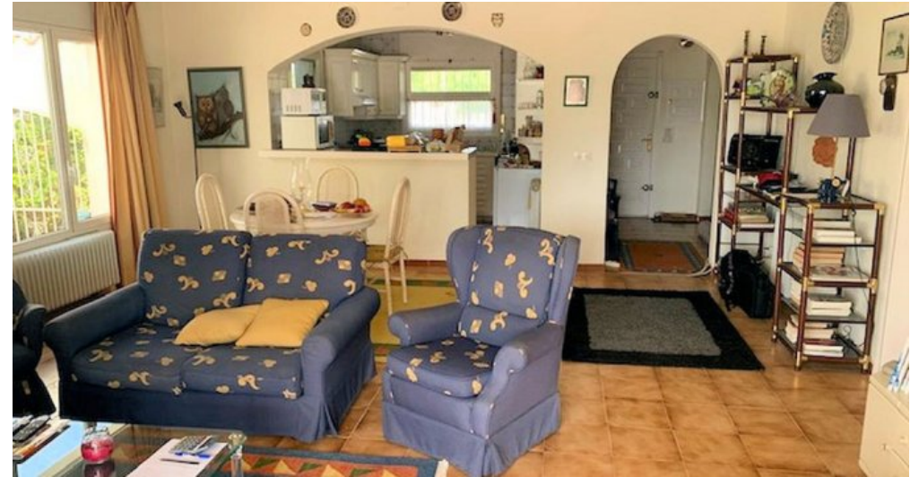
Empuriabrava Ferienhaus mit privatem Pool und Bootsanleger von 15m