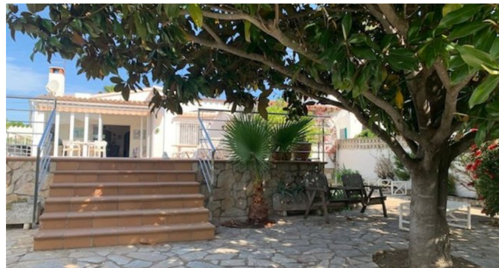
Empuriabrava Ferienhaus mit privatem Pool und Bootsanleger von 15m