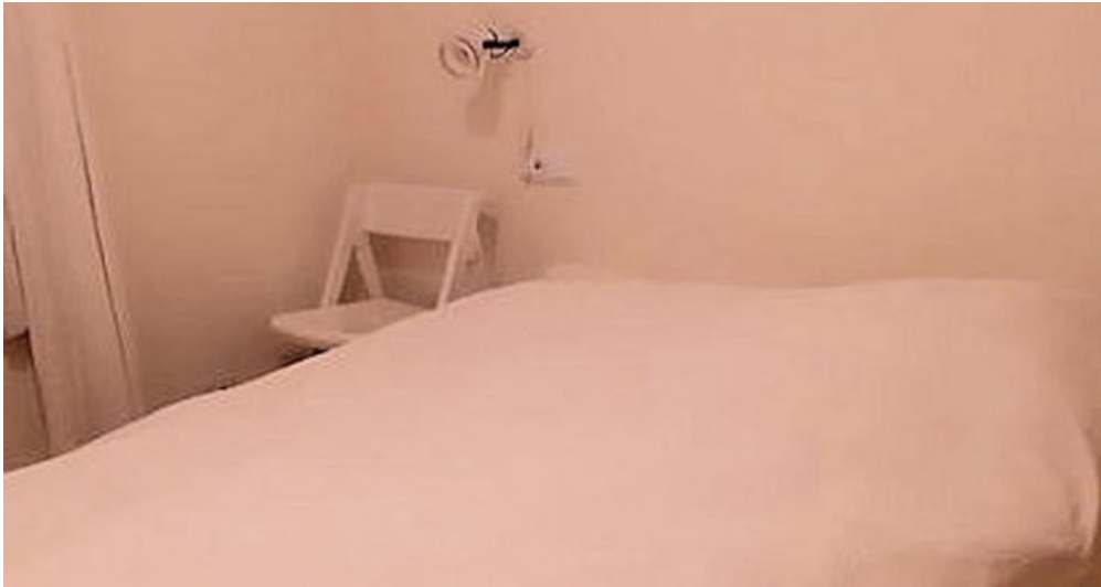
Empuriabrava Ferienhaus mit privatem Pool und Bootsanleger von 15m