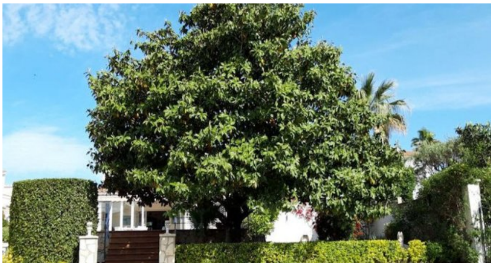
Empuriabrava Ferienhaus mit privatem Pool und Bootsanleger von 15m