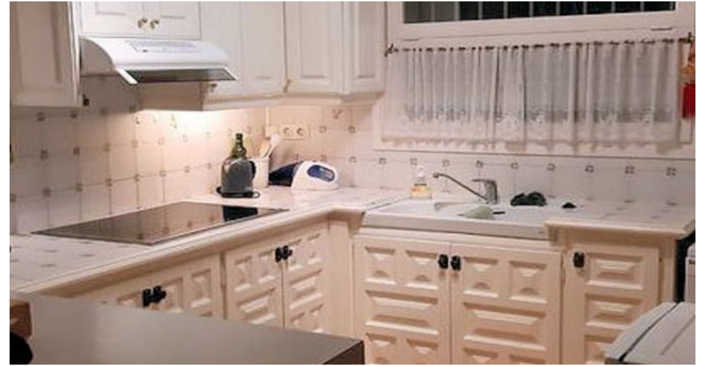
Empuriabrava Ferienhaus mit privatem Pool und Bootsanleger von 15m