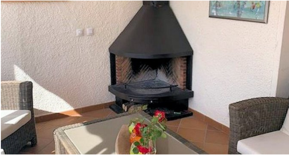
Empuriabrava Ferienhaus mit privatem Pool und Bootsanleger von 15m