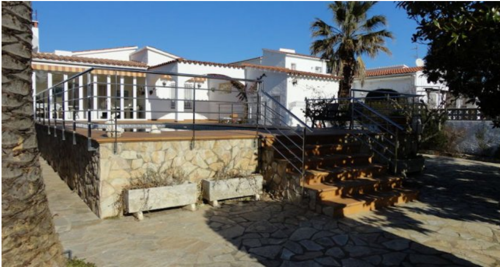
Empuriabrava Ferienhaus mit privatem Pool und Bootsanleger von 15m