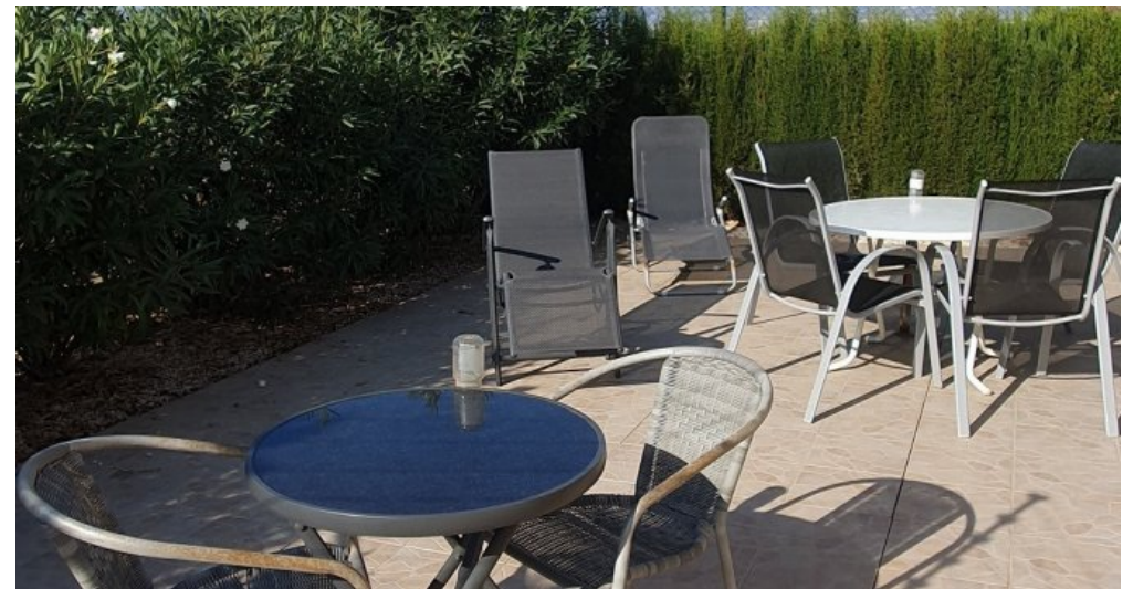
Ferienhaus Spanien Region Murcia Costa Calida