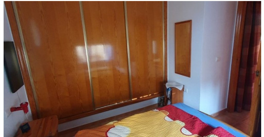
Ferienhaus Spanien Region Murcia Costa Calida