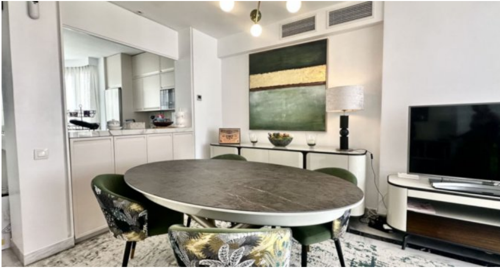
Zu Verkaufen: Appartement in Marbella am Strand der Costa del Sol