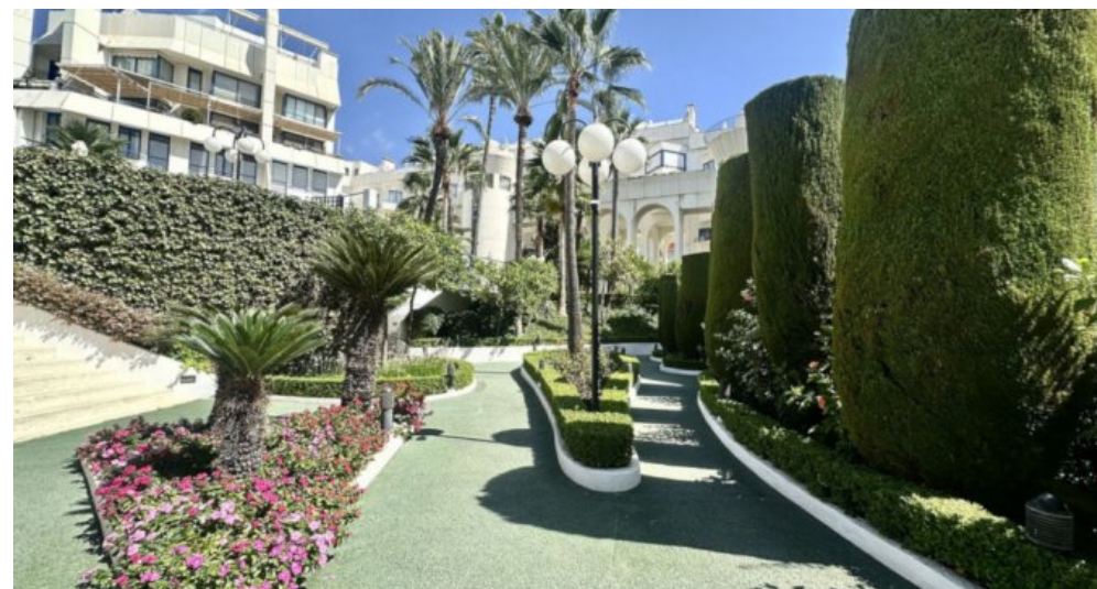
Zu Verkaufen: Appartement in Marbella am Strand der Costa del Sol