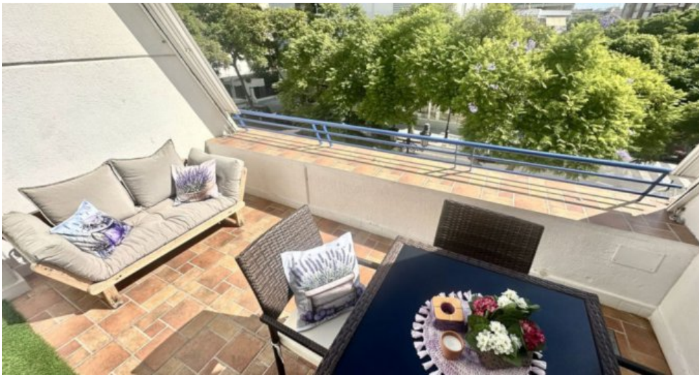
Zu Verkaufen: Appartement in Marbella am Strand der Costa del Sol