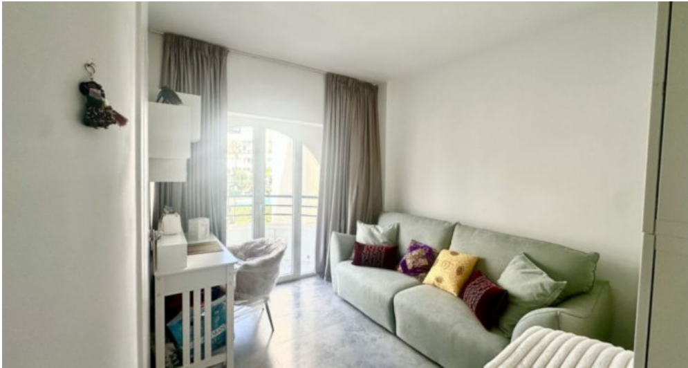
Zu Verkaufen: Appartement in Marbella am Strand der Costa del Sol