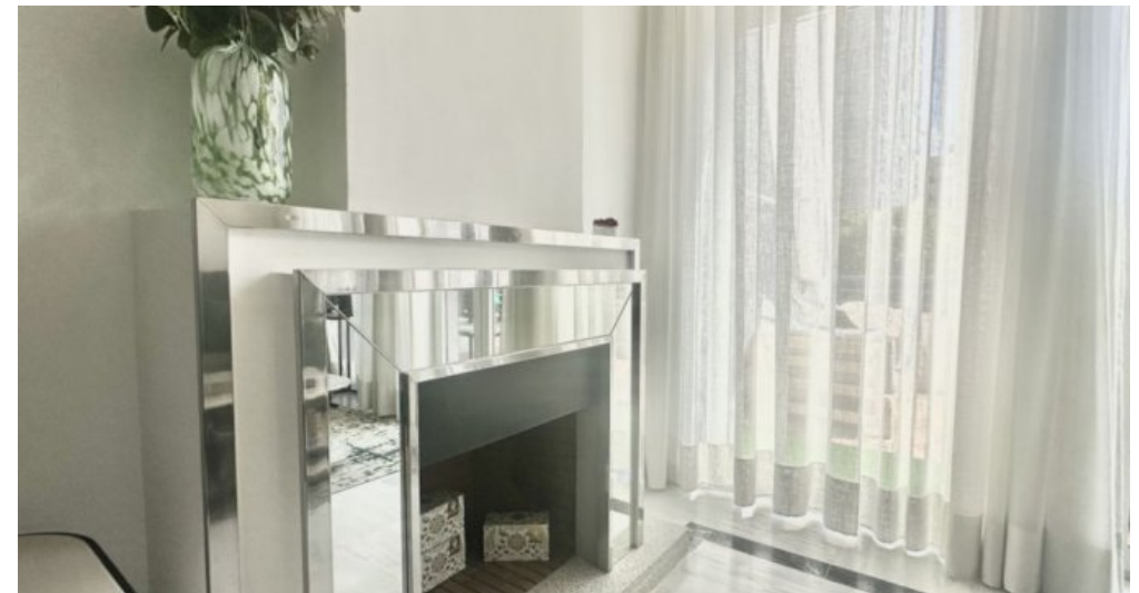
Zu Verkaufen: Appartement in Marbella am Strand der Costa del Sol