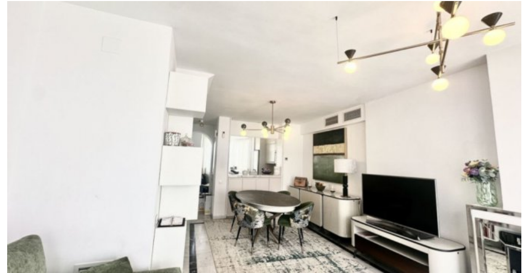
Zu Verkaufen: Appartement in Marbella am Strand der Costa del Sol