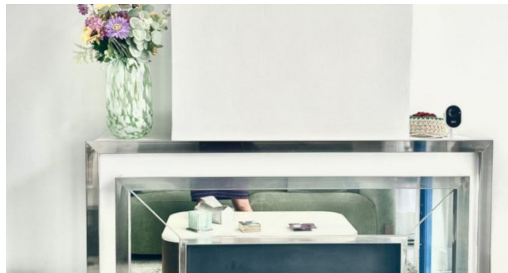
Zu Verkaufen: Appartement in Marbella am Strand der Costa del Sol