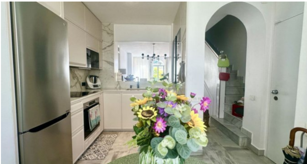
Zu Verkaufen: Appartement in Marbella am Strand der Costa del Sol