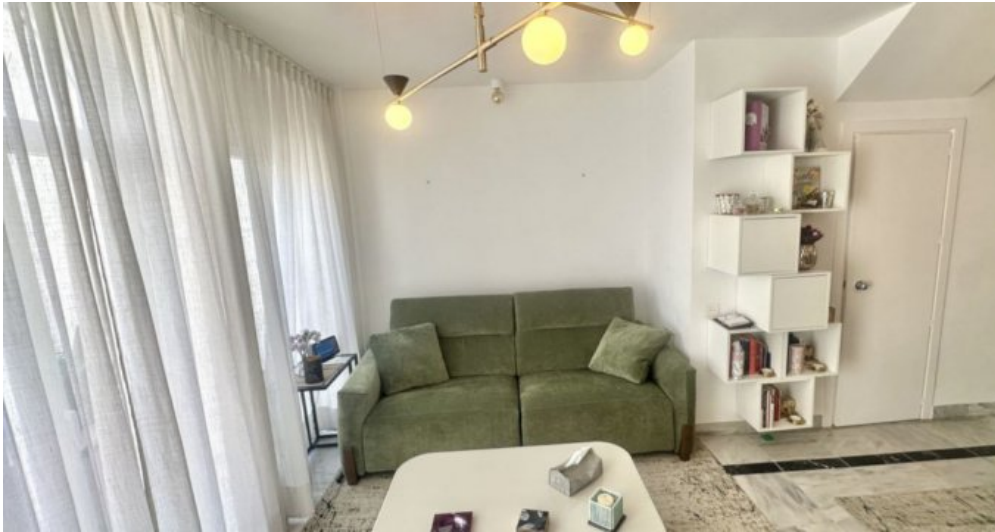
Zu Verkaufen: Appartement in Marbella am Strand der Costa del Sol