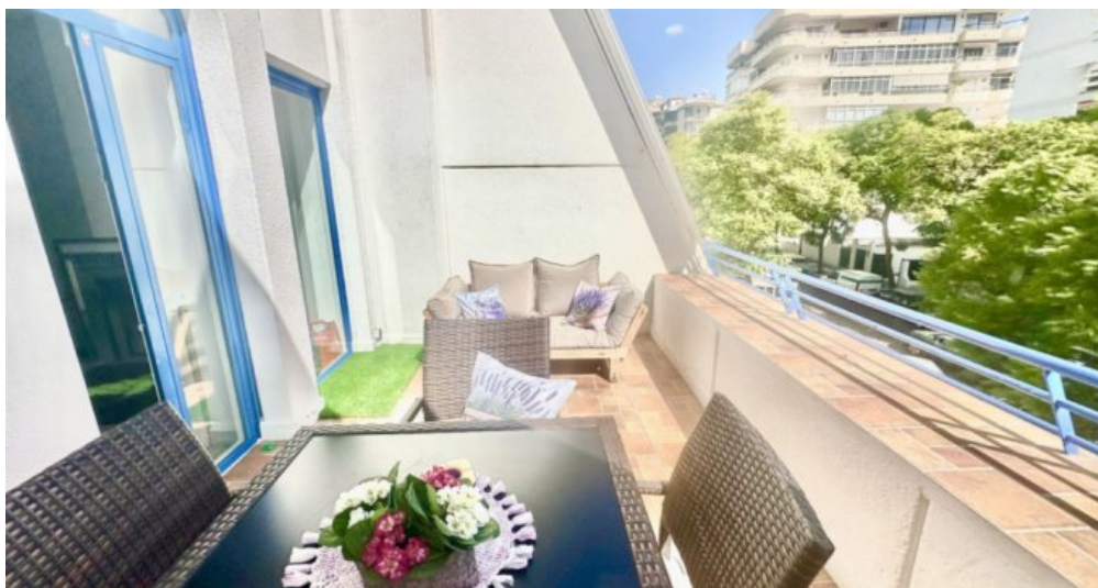
Zu Verkaufen: Appartement in Marbella am Strand der Costa del Sol