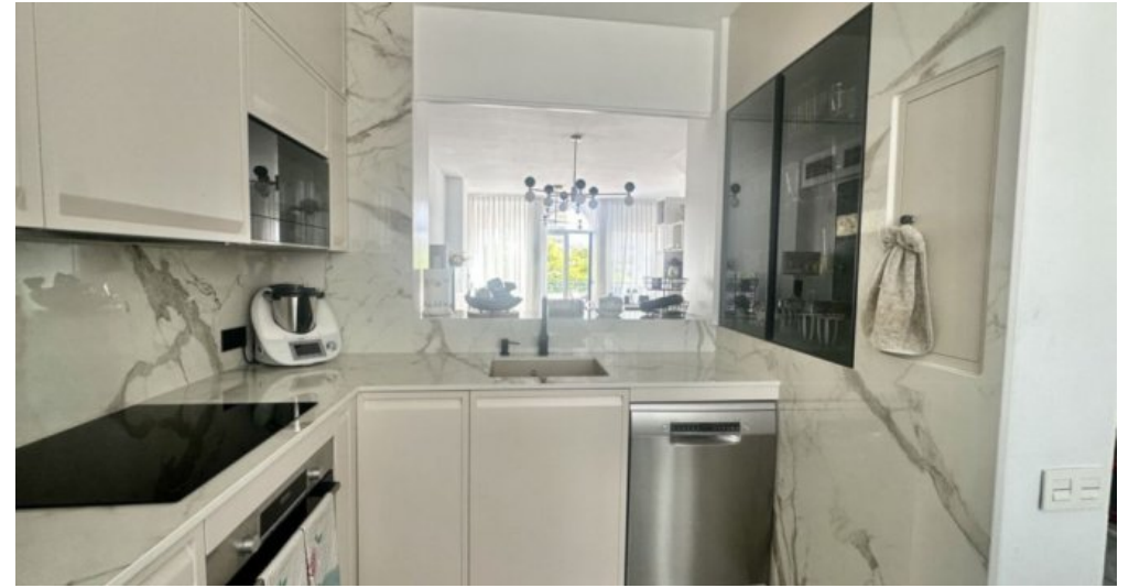
Zu Verkaufen: Appartement in Marbella am Strand der Costa del Sol