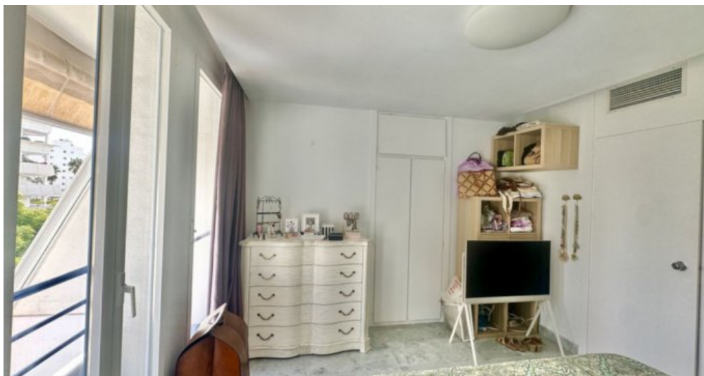
Zu Verkaufen: Appartement in Marbella am Strand der Costa del Sol