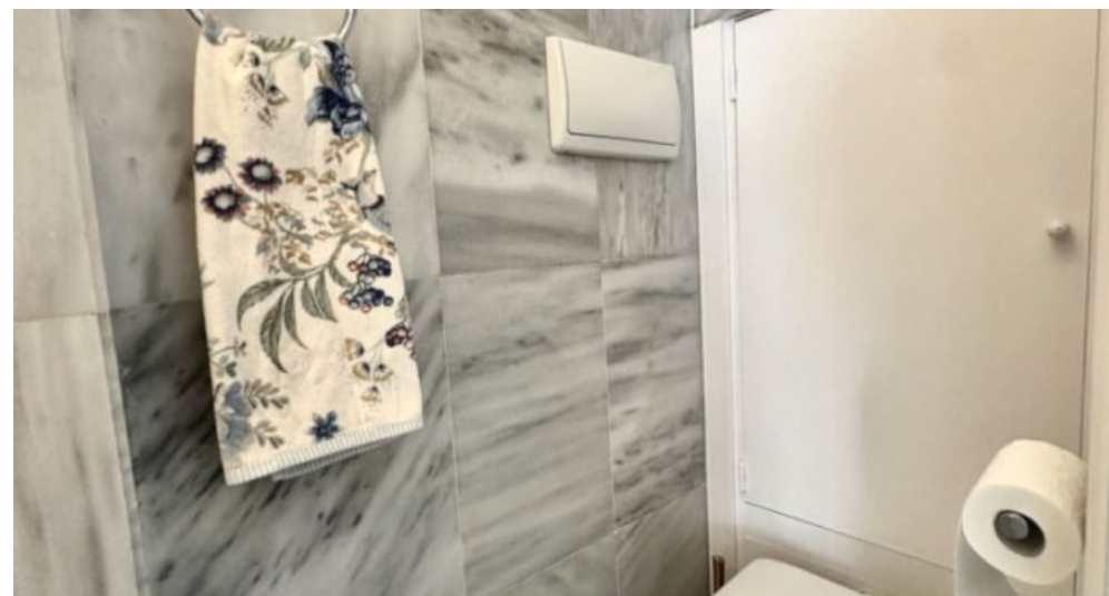
Zu Verkaufen: Appartement in Marbella am Strand der Costa del Sol