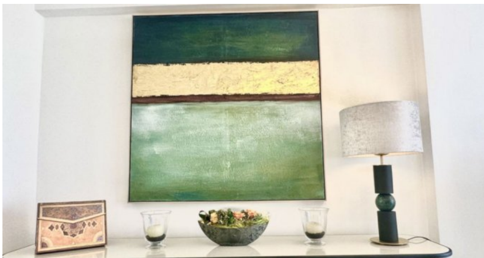
Zu Verkaufen: Appartement in Marbella am Strand der Costa del Sol