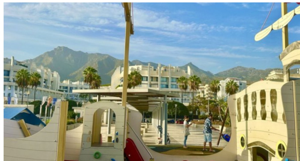
Zu Verkaufen: Appartement in Marbella am Strand der Costa del Sol