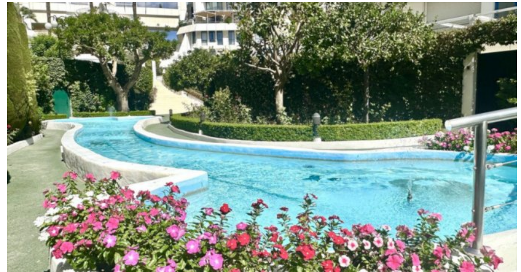
Zu Verkaufen: Appartement in Marbella am Strand der Costa del Sol