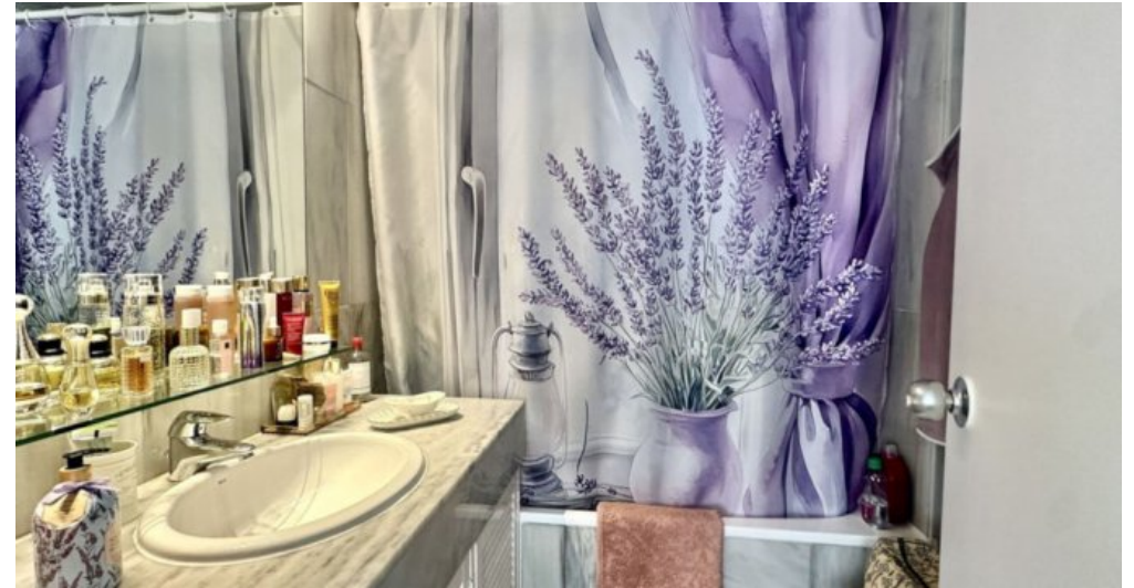
Zu Verkaufen: Appartement in Marbella am Strand der Costa del Sol