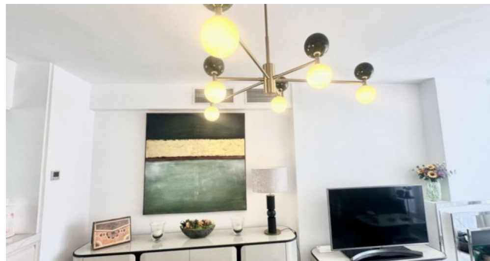
Zu Verkaufen: Appartement in Marbella am Strand der Costa del Sol