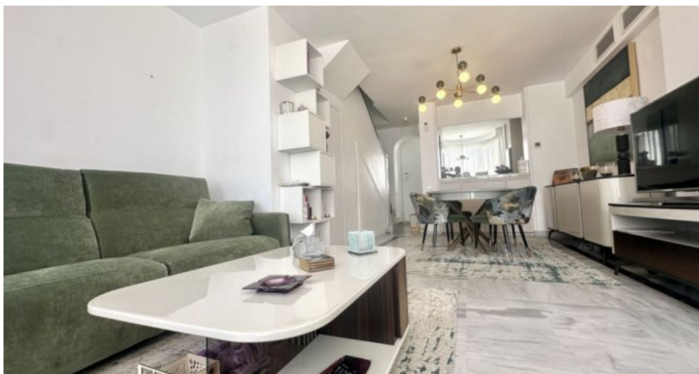
Zu Verkaufen: Appartement in Marbella am Strand der Costa del Sol