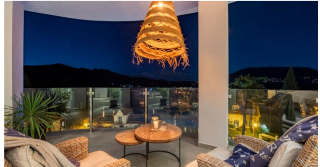
Luxus Immobilie Marbella Costa del Sol kaufen