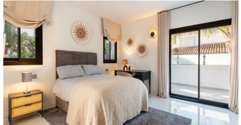
Luxus Immobilie Marbella Costa del Sol kaufen