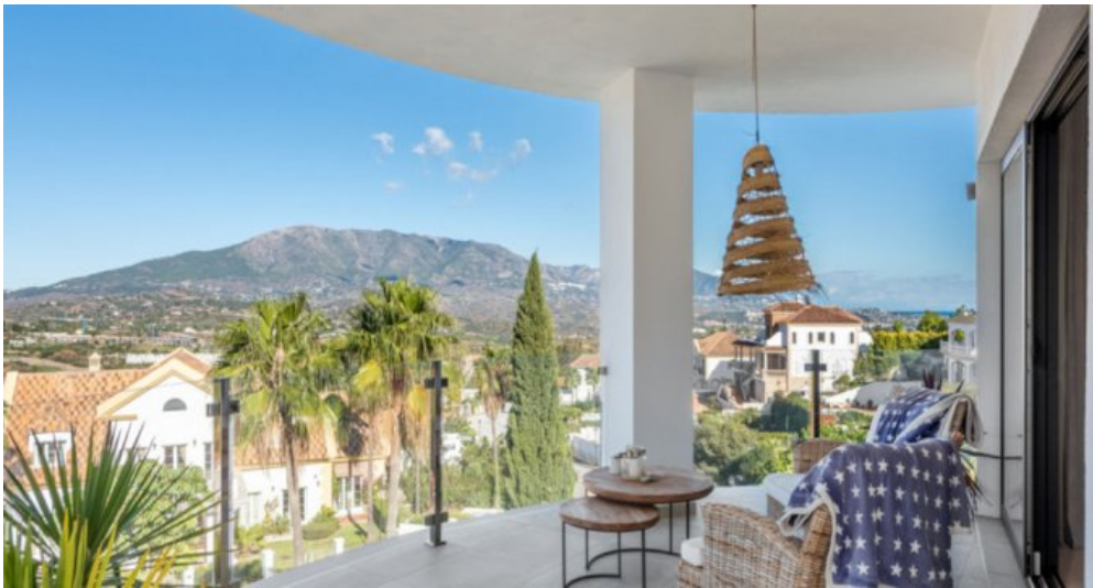
Luxus Immobilie Marbella Costa del Sol kaufen