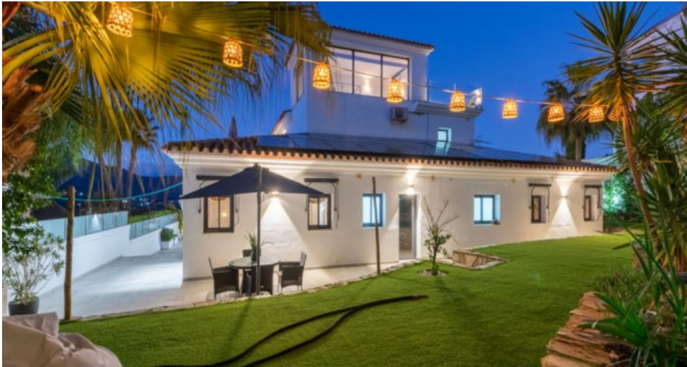
Luxus Immobilie Marbella Costa del Sol kaufen