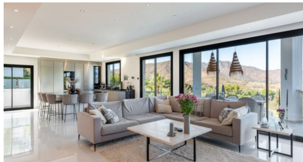
Luxus Immobilie Marbella Costa del Sol kaufen