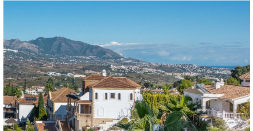
Luxus Immobilie Marbella Costa del Sol kaufen