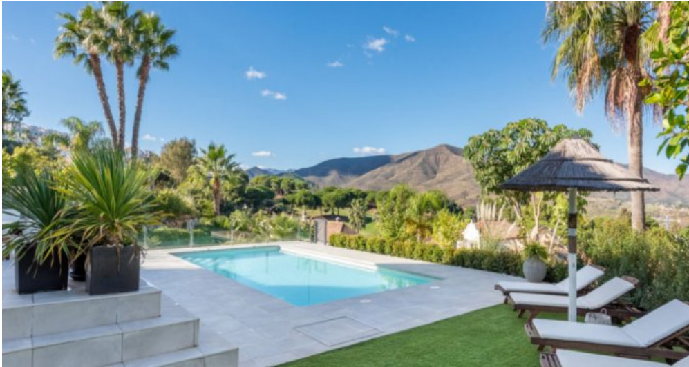
Luxus Immobilie Marbella Costa del Sol kaufen