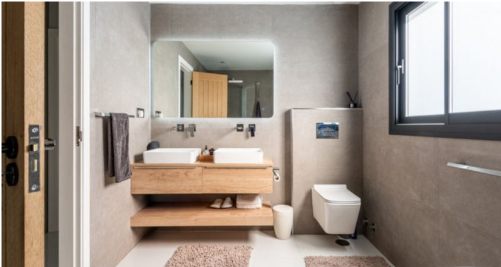
Luxus Immobilie Marbella Costa del Sol kaufen