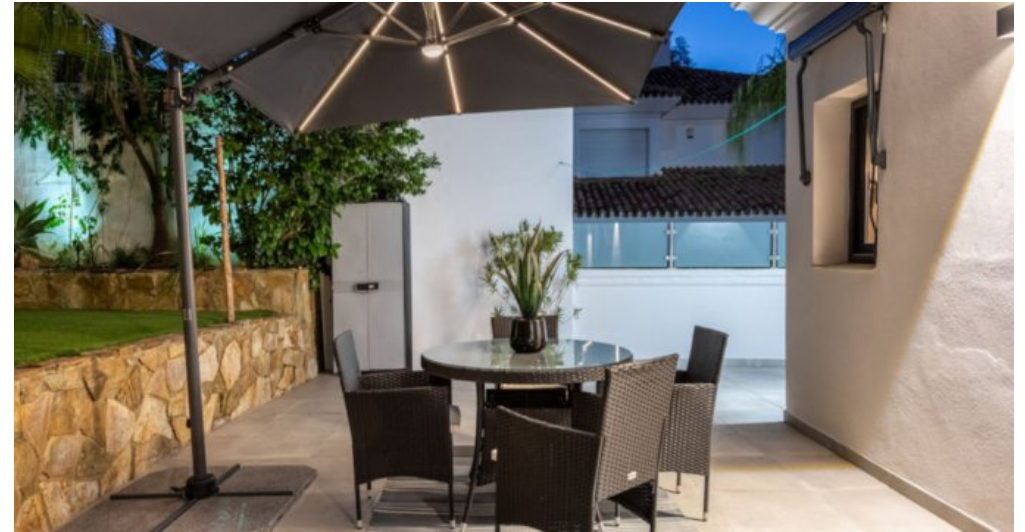
Luxus Immobilie Marbella Costa del Sol kaufen