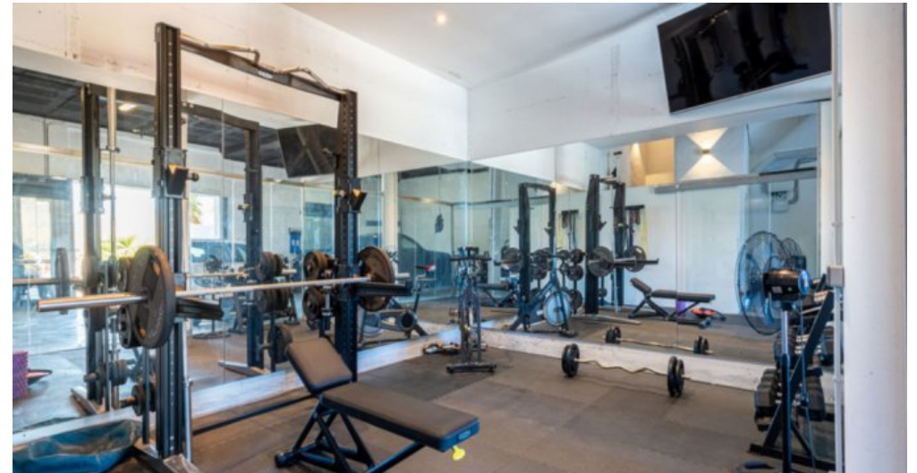
Luxus Immobilie Marbella Costa del Sol kaufen