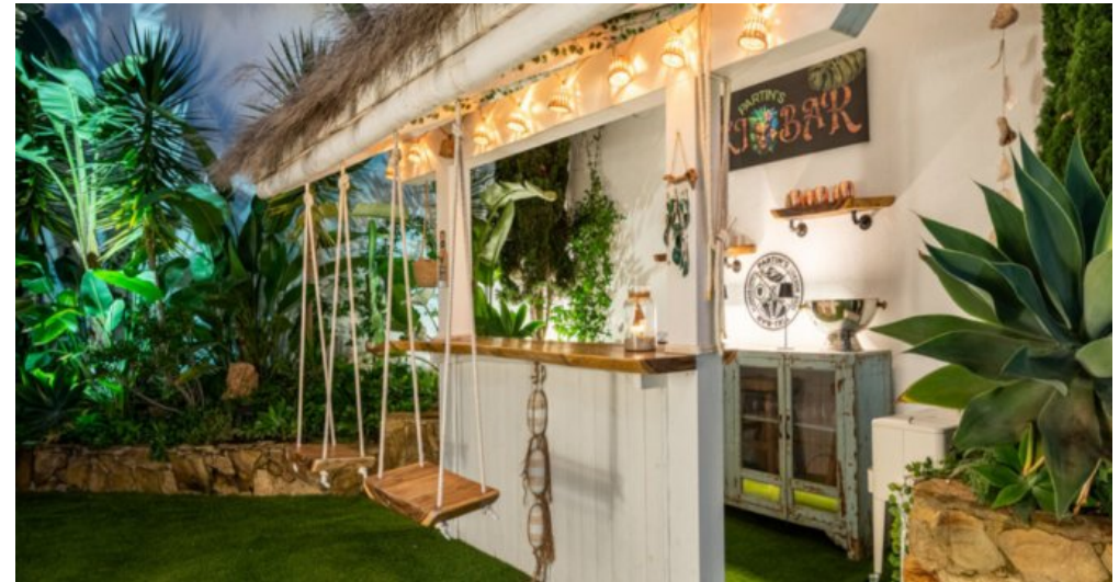
Luxus Immobilie Marbella Costa del Sol kaufen