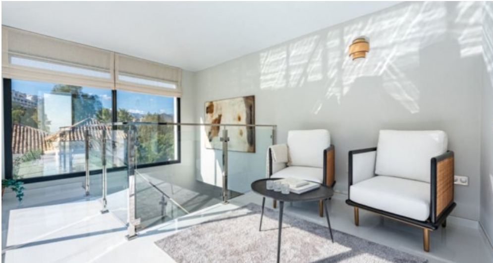
Luxus Immobilie Marbella Costa del Sol kaufen