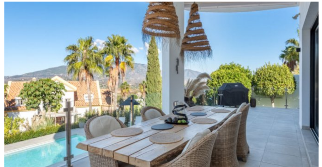
Luxus Immobilie Marbella Costa del Sol kaufen