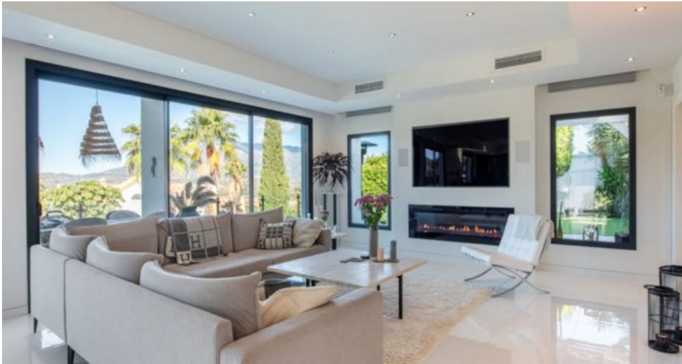
Luxus Immobilie Marbella Costa del Sol kaufen