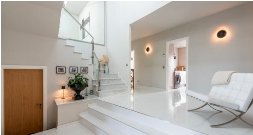
Luxus Immobilie Marbella Costa del Sol kaufen