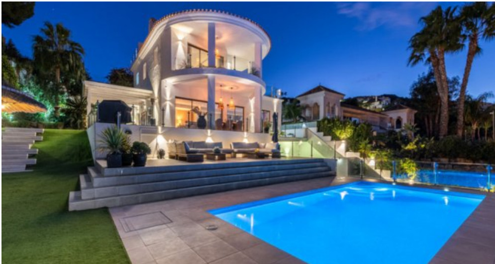
Luxus Immobilie Marbella Costa del Sol kaufen