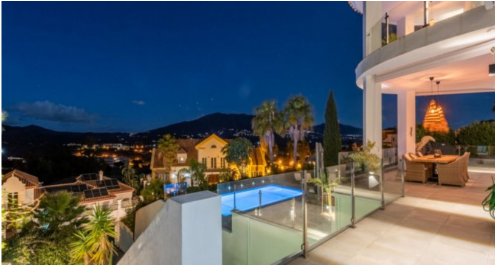
Luxus Immobilie Marbella Costa del Sol kaufen