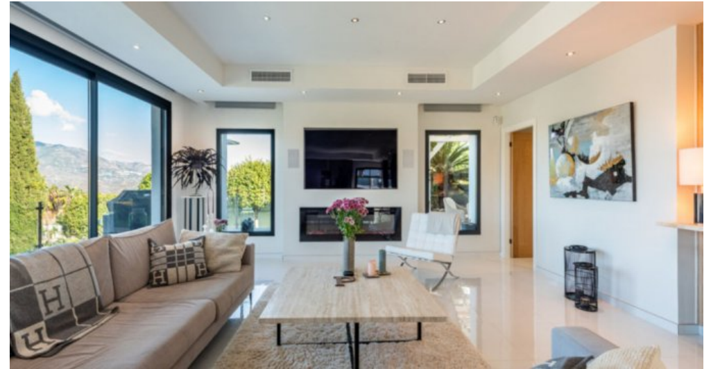
Luxus Immobilie Marbella Costa del Sol kaufen