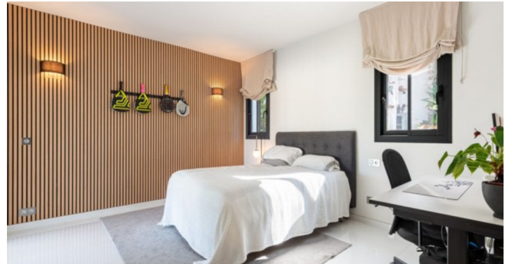
Luxus Immobilie Marbella Costa del Sol kaufen