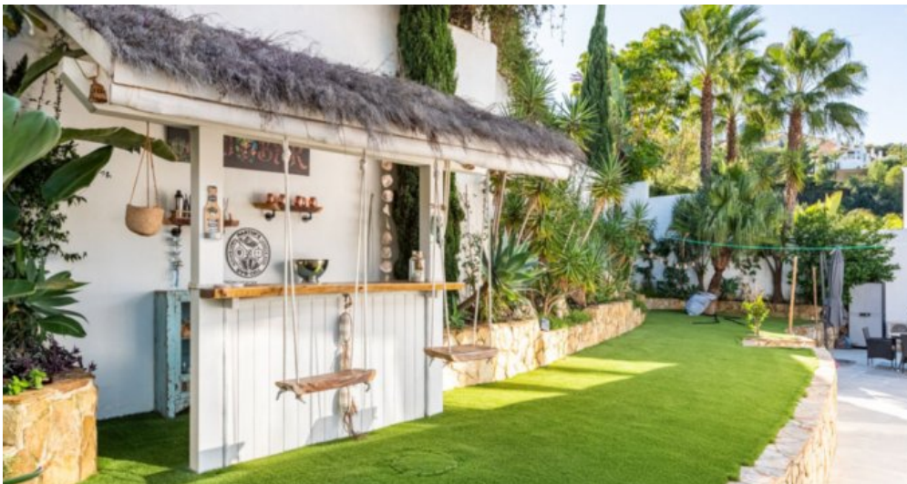
Luxus Immobilie Marbella Costa del Sol kaufen