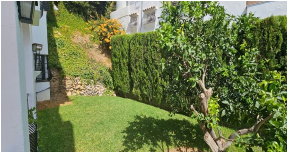
Exklusive Villa mit Meerblick in Campo Mijas bei Marbella