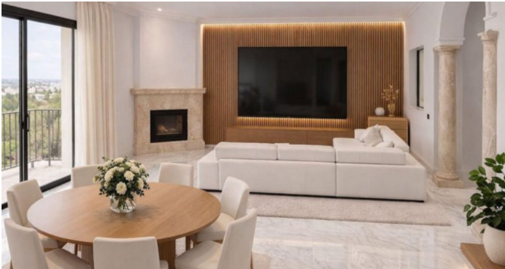
Exklusive Villa mit Meerblick in Campo Mijas bei Marbella