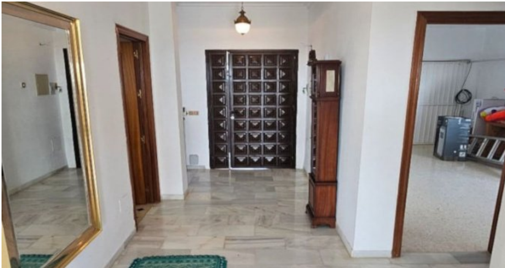
Exklusive Villa mit Meerblick in Campo Mijas bei Marbella