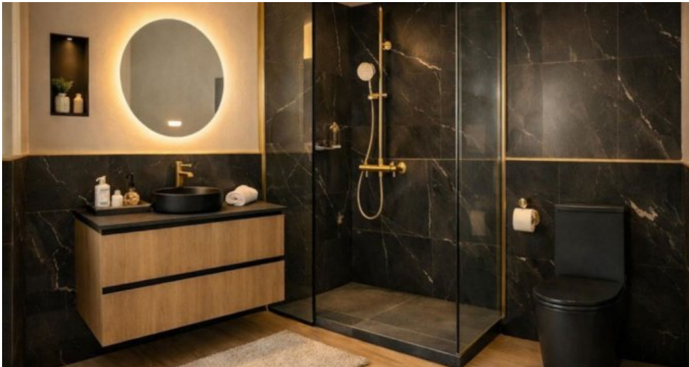
Exklusive Villa mit Meerblick in Campo Mijas bei Marbella