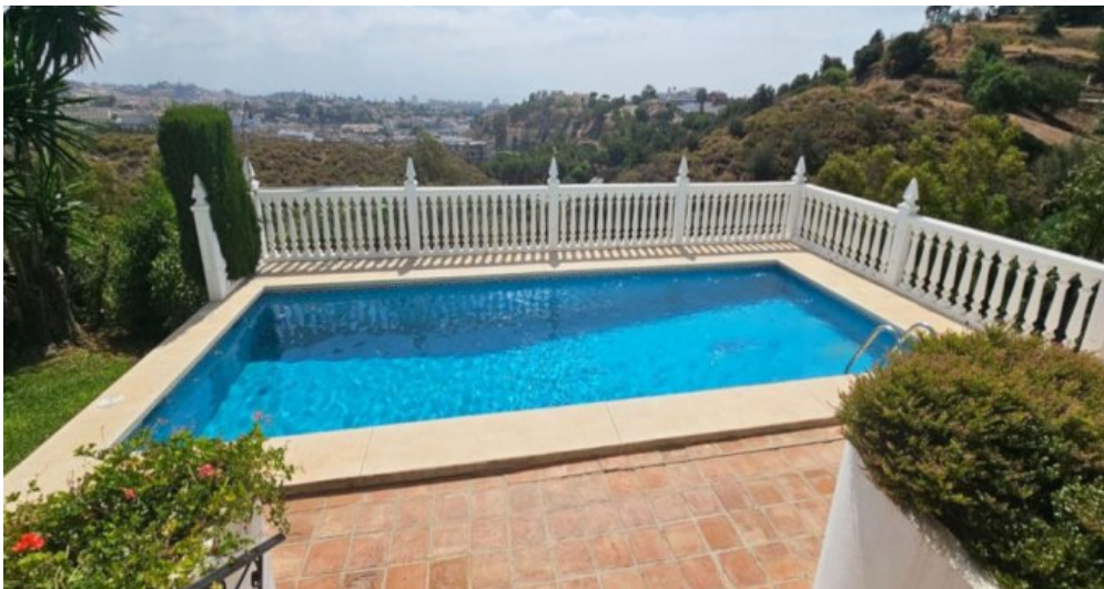
Exklusive Villa mit Meerblick in Campo Mijas bei Marbella