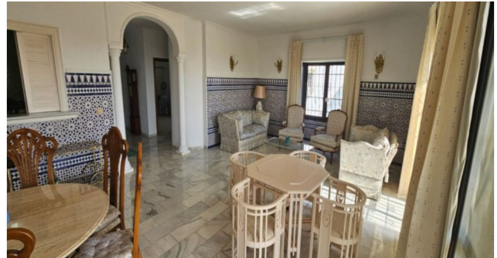
Exklusive Villa mit Meerblick in Campo Mijas bei Marbella