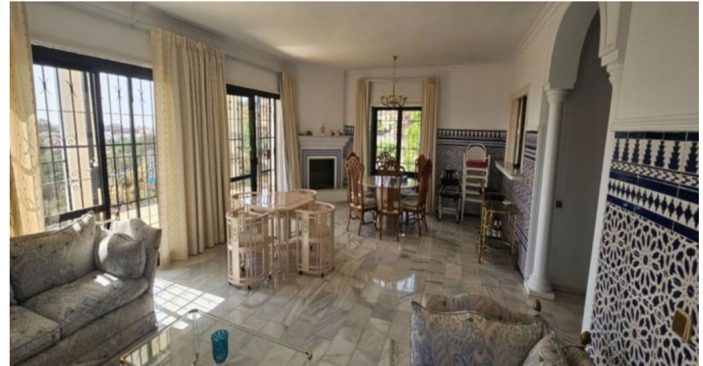
Exklusive Villa mit Meerblick in Campo Mijas bei Marbella