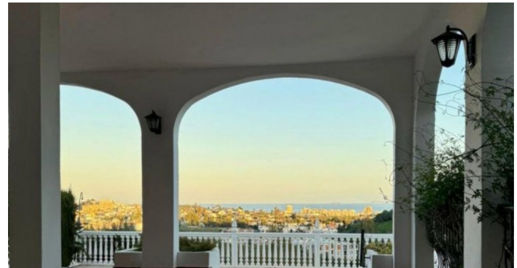
Exklusive Villa mit Meerblick in Campo Mijas bei Marbella