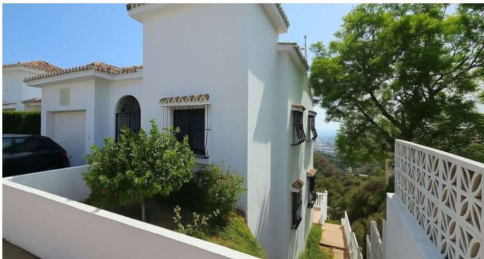
Exklusive Villa mit Meerblick in Campo Mijas bei Marbella