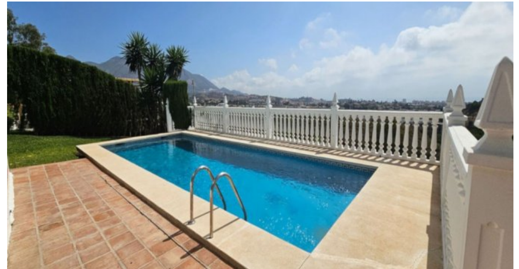
Exklusive Villa mit Meerblick in Campo Mijas bei Marbella