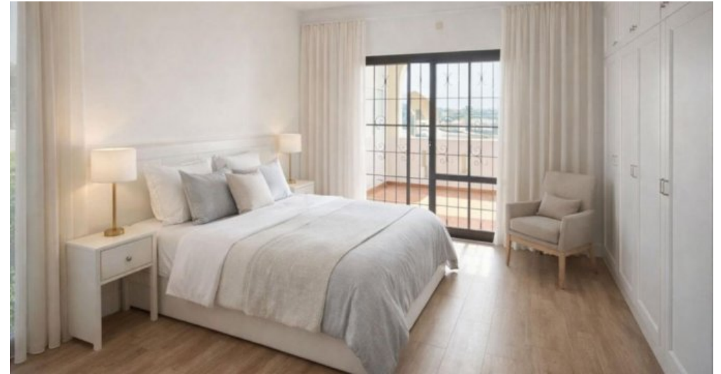
Exklusive Villa mit Meerblick in Campo Mijas bei Marbella