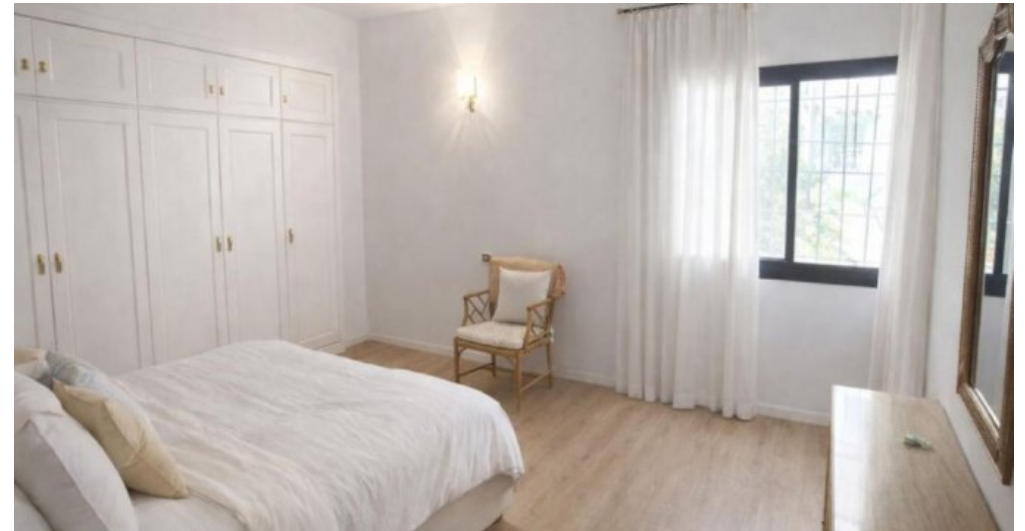
Exklusive Villa mit Meerblick in Campo Mijas bei Marbella