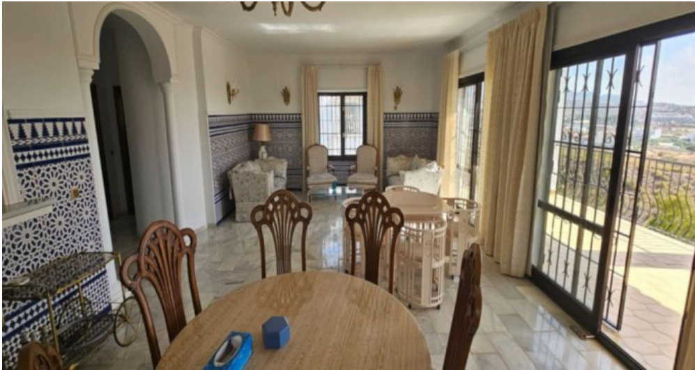
Exklusive Villa mit Meerblick in Campo Mijas bei Marbella