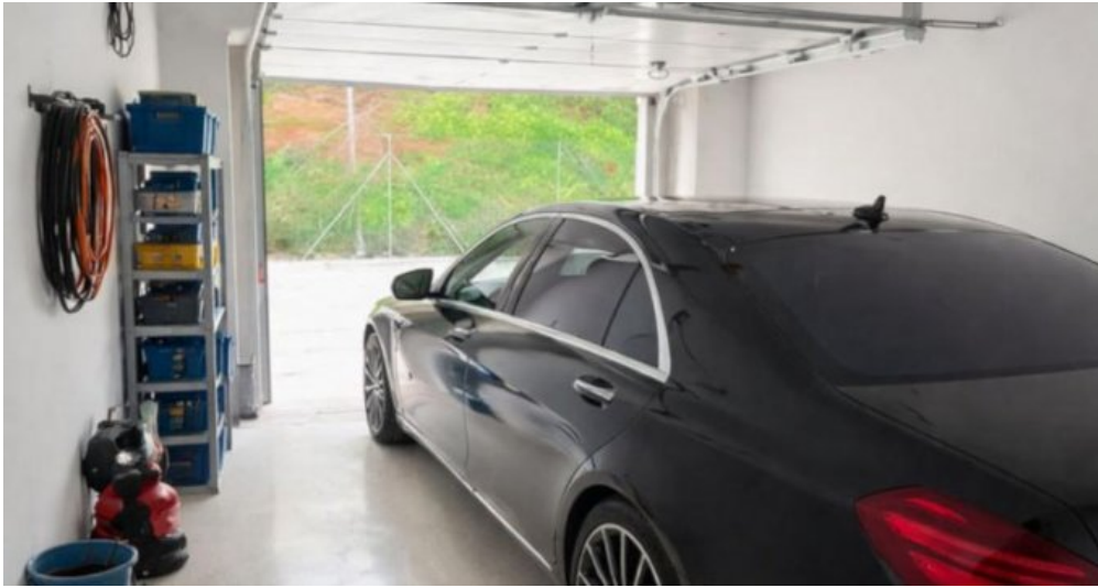
Exklusive Villa mit Meerblick in Campo Mijas bei Marbella