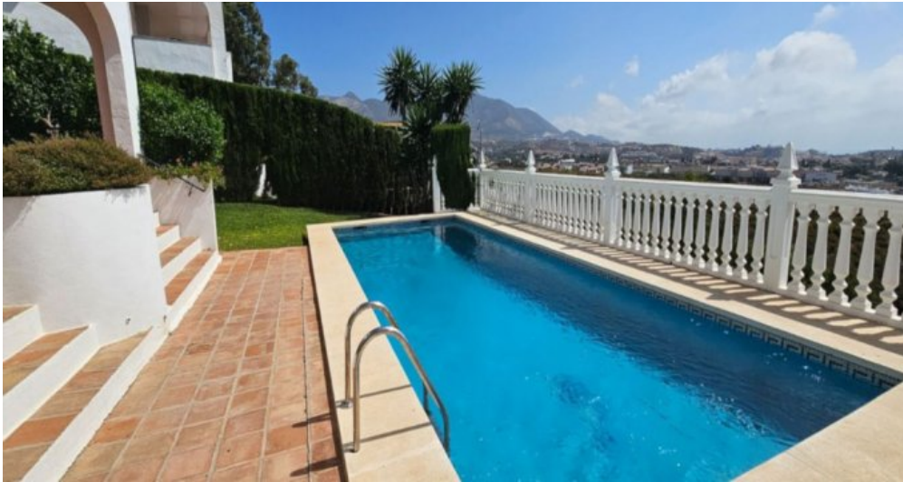
Exklusive Villa mit Meerblick in Campo Mijas bei Marbella