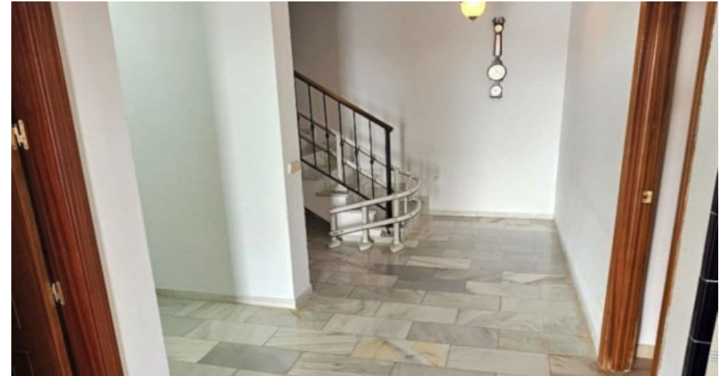
Exklusive Villa mit Meerblick in Campo Mijas bei Marbella