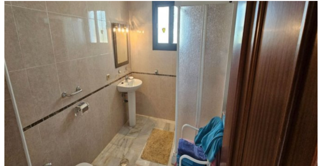
Exklusive Villa mit Meerblick in Campo Mijas bei Marbella