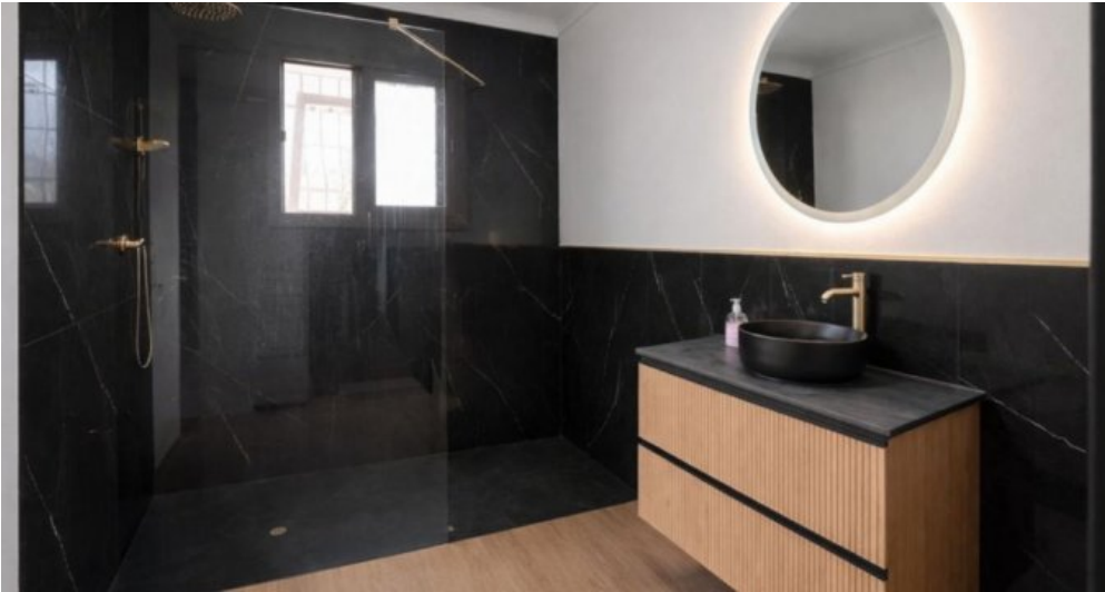
Exklusive Villa mit Meerblick in Campo Mijas bei Marbella