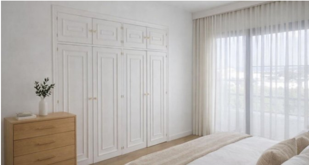
Exklusive Villa mit Meerblick in Campo Mijas bei Marbella