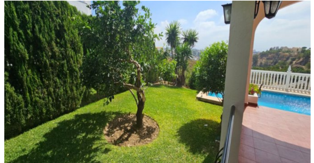
Exklusive Villa mit Meerblick in Campo Mijas bei Marbella